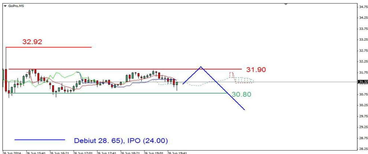
Wykres 4. Kontrakty CFD na spółkę GoPro

PROGNOZA: Dla osób kupujących spółkę w ofercie publicznej zysk wyniósł 30.5%. To bardzo dużo. Na rynku w USA trwa korekta. Istnieje duża pokusa realizacji zysków. W mojej ocenie należy liczyć się z możliwością wybicia w dół z konsolidacji w rejonie 30.80-31.90 USD. Zasięg można szacować na okolice 29.70 USD. Wtedy z czwartkowego szczytu widoczna będzie spadkowa trójka, jeśli przecena skończy się na tym to w dalszej perspektywie można będzie liczyć na powrót w rejon czwartkowego szczytu, gdzie mamy silną opór.