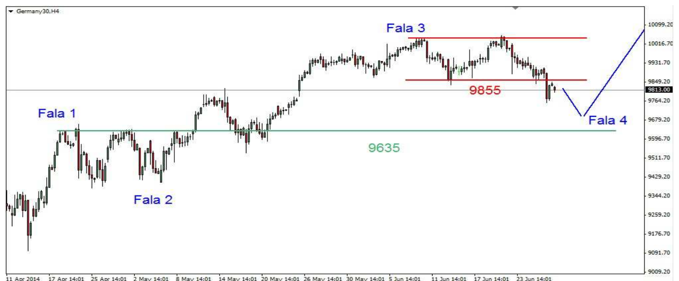
Wykres 3. Kontrakty CFD na indeks DAX

NIEMCY (Kontrakty DAX) W czwartek doszło do spadku poniżej ważnego wsparcia w rejonie 9855pkt. Wielosesyjne minimum wypadło na poziomie 9757pkt. Po godzinie 16-tej kontrakty zaczęły odrabiać straty. Zamknięcie po 9838pkt. (wykres 3).