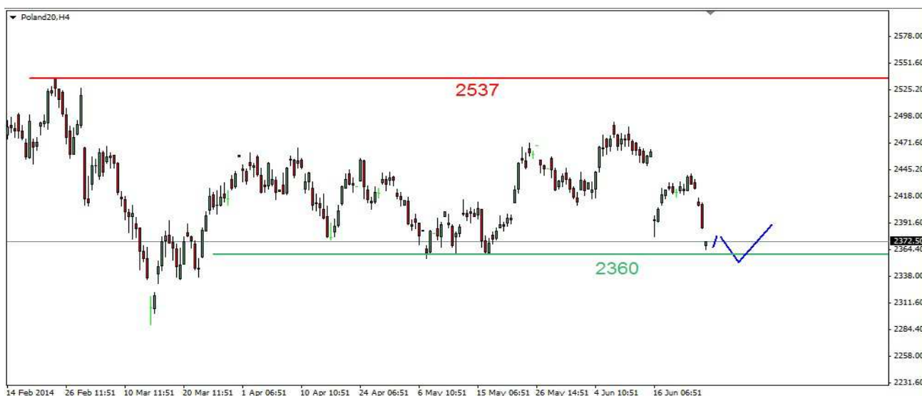
Wykres 1. Kontrakty na indeks WIG20

PROGNOZA Wsparcie w rejonie 2400pkt. może być wykorzystane przez popyt do zainicjowania odbicia. Obawiam się, że może być ono nietrwałe i podaż zepchnie indeks na majowe dołki (2372-2376pkt.). Dopiero potem zobaczymy trwalsze odbicie (wykres 1). W dalszej kilkutygodniowej perspektywie oczekuję kolejnej fali wzrostów i ataku na szczyt z lutego na poziomie 2527pkt.