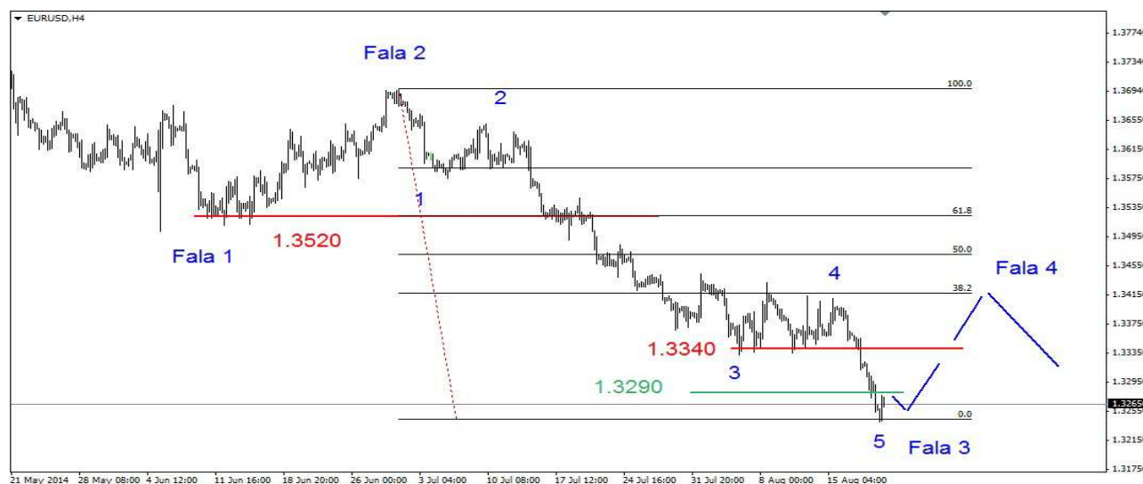
Wykres 1. Eurodolar w perspektywie średnioterminowej

GBP/USD W środę rano doszło do spadku do poziomu 1.6601 USD. Potem rozpoczęło się spore odbicie, dotarło do 1.6678 USD. Przed 11-tą rozpoczęła się realizacja zysków. Dzielne dno wypadło na poziomie 1.6589 USD, zamknięcie nisko po 1.6594 USD. Dziś w nocy kurs funta spadł do 1.6563 USD, potem doszło do