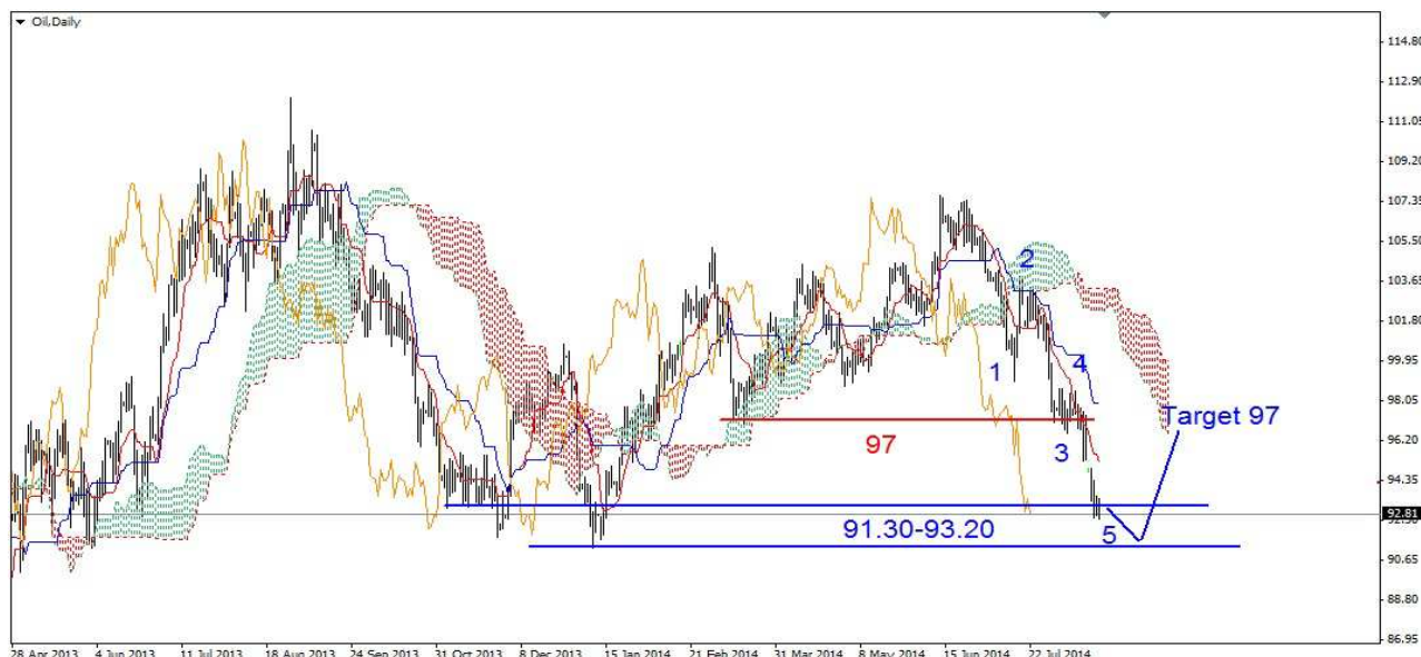
Wykres 6. Kontrakty CFD na ropę

PROGNOZA: Długoterminowe dołki znajdują się w obszarze 91.30-93.20 USD. Za kilka sesji może dojść do przesilenia i rozpocznie się mocniejsze wielosecyjne odbicie znoszące np. 38% spadków z tegorocznego szczytu.