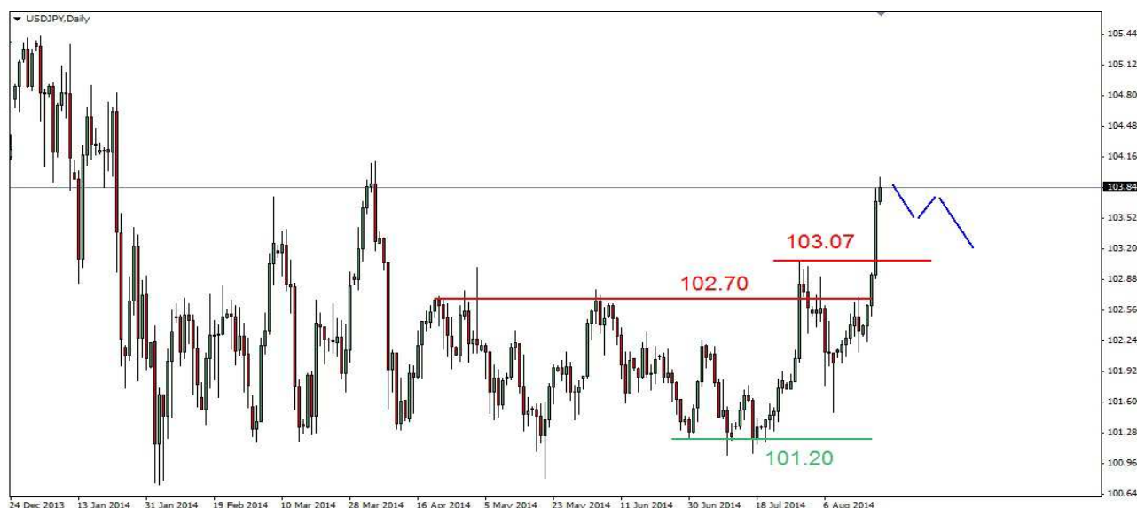
Wykres 3. Dolar amerykański w relacji do jena (USD/JPY)

USD/PLN W środę kurs dolara wzrósł do nowego kilkumiesięcznego szczytu na poziomie 3.1627 PLN, zamknięcie wysoko po 3.1565 PLN. Dziś rano doszło do wzrostu do 3.1631 PLN, obecnie dolar jest notowany po 3.1580 PLN. PROGNOZA: Kilkutygodniowa fala wzrostów może przyjąć postać 5-falowej