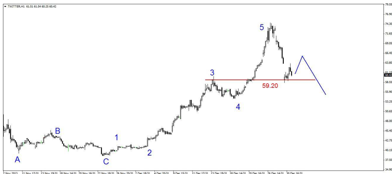
Wykres 3. Kontrakty CFD na spółkę Twitter

TWITTER – W piątek doszło do silnych spadków. Zamknięcie wypadło na dziennym dnie na poziomie 63.66 USD. W poniedziałek kurs spółki otworzył się z luką bessy i spadł do poziomu 58.48 USD, w ciągu sesji doszło do odbicia. Zamknięcie po 60.42 USD (wykres 3).