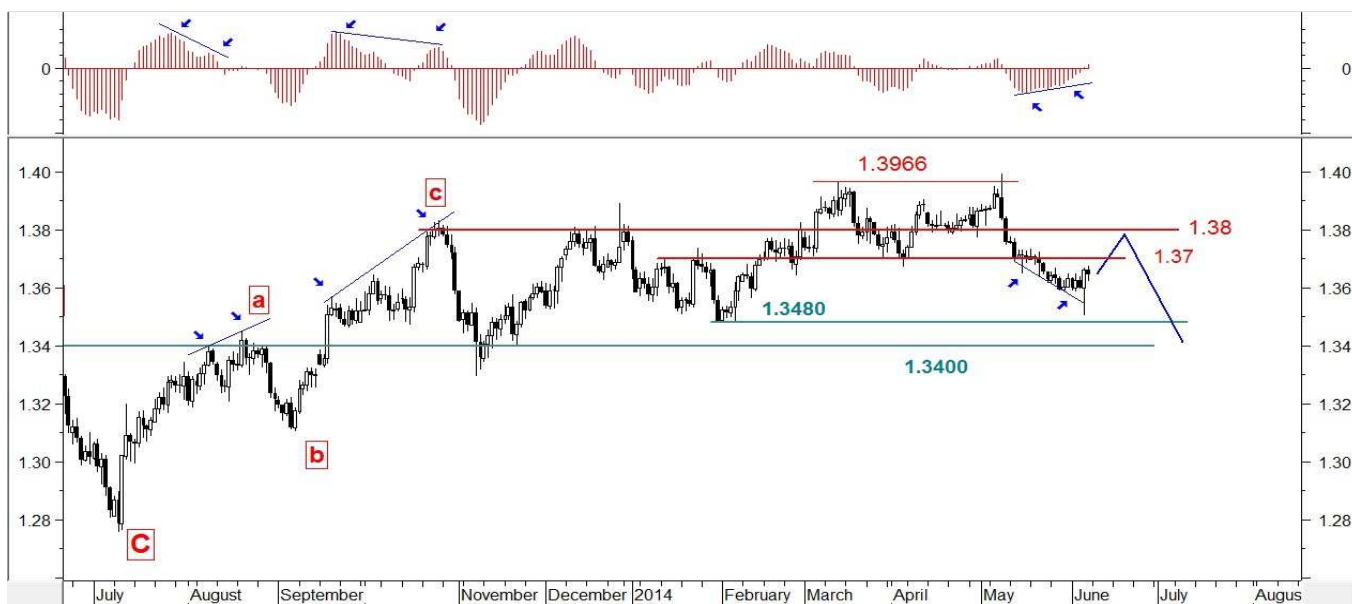
Wykres 6. Eurodolar w perspektywie ostatnich kilkunastu miesięcy

Po przebicciu wsparcia w rejonie 1.3583-1.3588 USD otworzy się droga do spadku do ważnego średnioterminowego wsparcia w okolicy 1.34 USD. W dalszej perspektywie możliwe są mocniejsze spadki nawet w rejon ubiegłorocznego dna na poziomie 1.2756 USD.