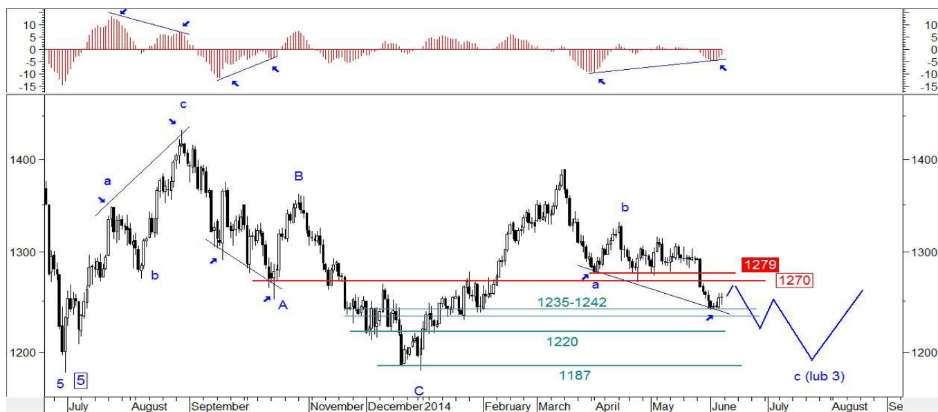
Wykres 8. Kurs kontraktów na złoto w perspektywie długoterminowej

Układ fal ze szczytu z 22-go maja (1303.60 USD) do dna z 30-go maja (1242.50 USD) może wskazywać, że wybiecie z kilkusecyjnej fazy konsolidacji ma szansę być kontynuowane i będzie jedynie korygować ten ruch. Silny opór znajduje się w rejonie 1270 USD zaś krytyczny opór to pułap 1279 USD (gdyby doszło do jego przebicia to dalszych spadków nie będzie).