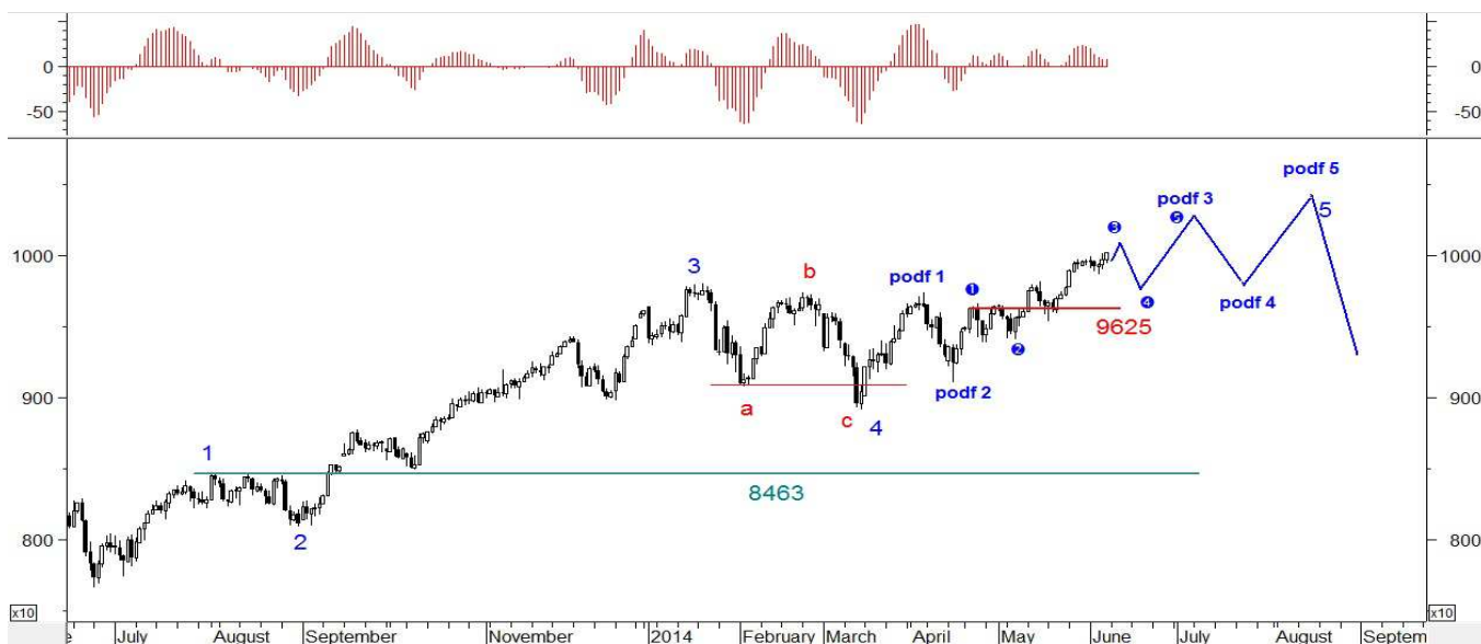
Wykres 3. Kontrakty na indeks DAX

Podobnie jak na wykresie kontraktów na indeks S&P500 z kwietniowego dna widoczna jest na razie 3-falowa struktura. Jesteśmy blisko zakończenia fali trzeciej. Wielosesyjny ruch w dół może się okazać korekcyjną falą czwartą. Krytyczne wsparcie jest na poziomie 9625pkt. Nie powinno być zagrożone. Potem czeka nas jeszcze jeden ruch w górę w ramach fali piątej. Środkowa najsilniejsza część trendu wzrostowego z marcowego dna będzie za nami. Po korekcie czeka na jeszcze jeden szczyt. Na jesieni możliwe jest przesilenie.