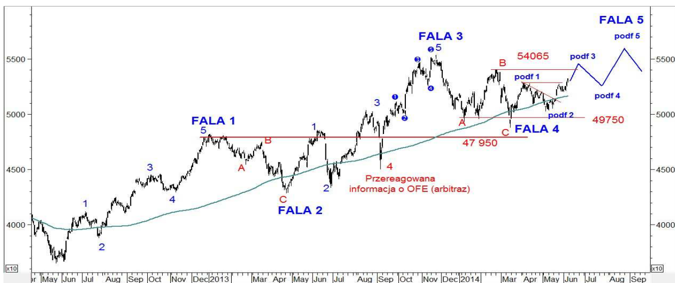
Wykres 4. Indeks WIG w układzie dziennym (od dna z 2012 roku)

Indeks WIG20 zachowywał się podobnie. Piątkowa sesja rozpoczęła się od wzrostów. Szczyt wypadł na poziomie 2492pkt. Próba przełamania czwartkowego szczytu (2493pkt.) nie udało się i po kilku minutach rynek zaczął się