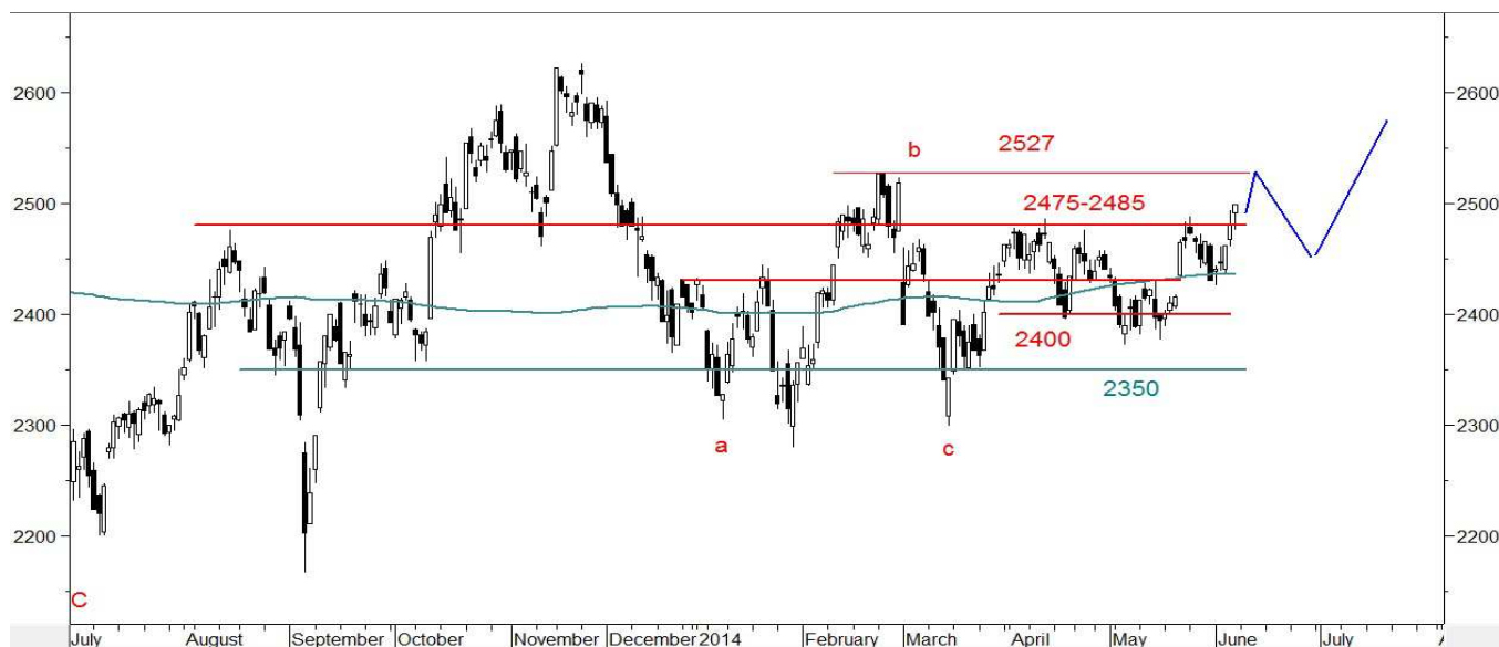
Wykres 5. Indeks WIG20 w układzie dziennym

W krótkim terminie możliwe jest zaatakowanie szczytu z lutego na poziomie 2527pkt. Potem korekta i dalsze wzrosty.