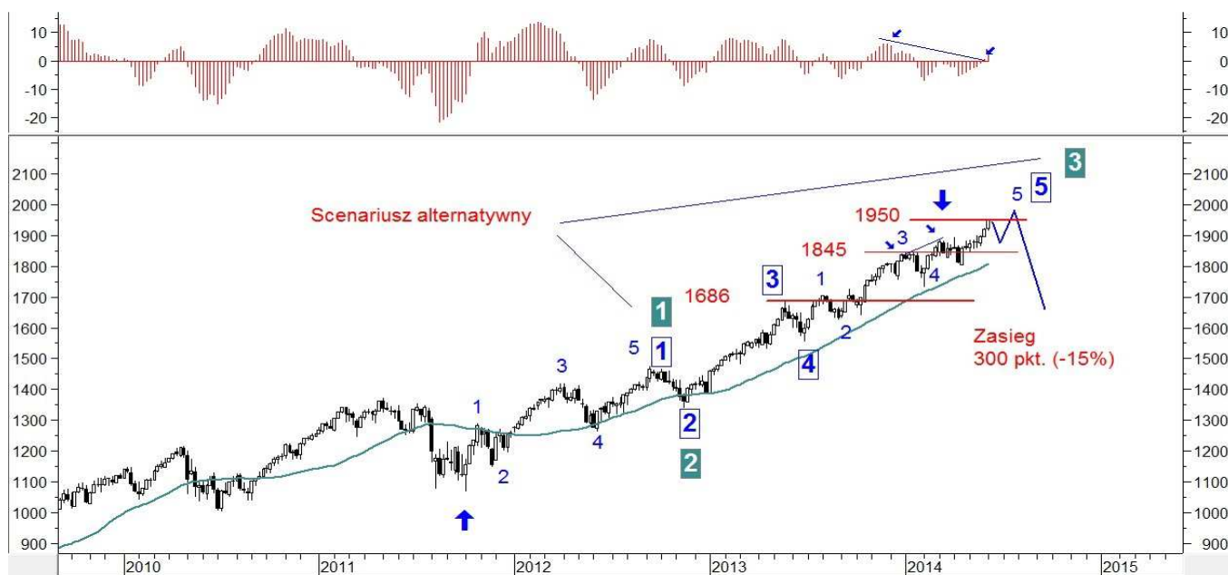
Wykres 2. Kontrakty na indeks S&P500 w układzie tygodniowym

Na wykresie przedstawiony jest scenariusz alternatywny w którym fala trzecia jeszcze się nie zakończyła. Trend z dna z jesieni 2011 roku potrwa więc jeszcze wiele miesięcy i mógłby się zakończyć w 2015 roku.