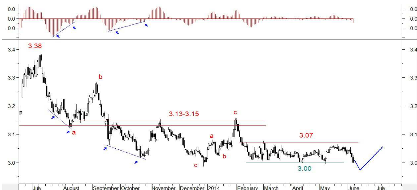
Wykres 7. Kurs dolara w relacji do złotego w perspektywie średnioterminowej

W ubiegłym tygodniu kurs dolara stracił w relacji do złotego. W czwartek osiągnięte zostało minimum na poziomie 3.0155 PLN, zaś w piątek zaatakowane zostało psychologiczne wsparcie (3.00 PLN). Dno wypadło na poziomie 2.9987 PLN. Piątkowe zamknięcie wypadło na poziomie 2.9994 PLN (wykres 7). Kursy zamknięcia euro i franka wypadły na poziomie 4.0923 PLN i 3.3576 PLN (poprzednio 4.1329 PLN oraz 3.3864 PLN).