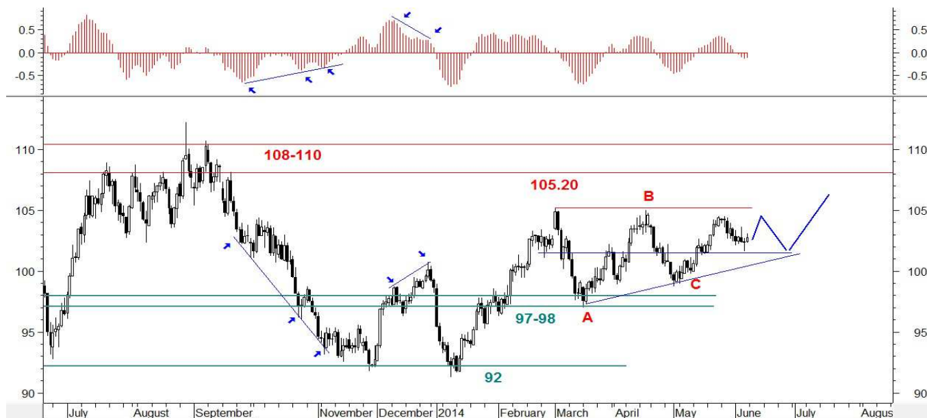
Wykres 9. Kurs kontraktów na ropę w perspektywie długoterminowej

Najbliższe dni mogą przynieść odbicie. Najprawdopodobniej będzie ono korekcyjne. Potem oczekuję kolejnego kilkusekcyjnego ruchu w dół. Wsparcie znajduje się w rejonie 101.50-102.00 USD. Próba jego trwałego przełamania nie powinna się udać. W dalszej perspektywie możliwy kolejny ruch w górę i atak na opór w rejonie 104.60-105.20 USD. Po jego przełamaniu otwiera się droga do bariery w obszarze 108-110 USD.