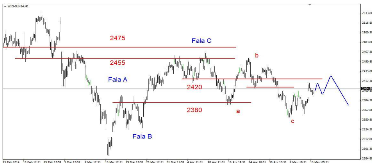
Wykres 1. Kontrakty na indeks WIG20

PROGNOZA: Na śródowej sesji możliwa jest kontynuacja korekty z wczorajszego szczytu (2431pkt.). Wsparcie znajduje się w rejonie 2413pkt. W czwartek możliwy kolejny ruch w górę, którego celem będzie pokonanie oporu w rejonie 2428-2431pkt. (wykres 1, na kontraktach jest to kilkanaście punktów niżej). Pokonanie tego oporu może doprowadzić do powrotu na kwietniowy szczyt (2457pkt.). Wcześniej jednak mamy opór w okolicy 2440pkt. W dalszej perspektywie możliwe jest wielosesyjne cofnięcie.