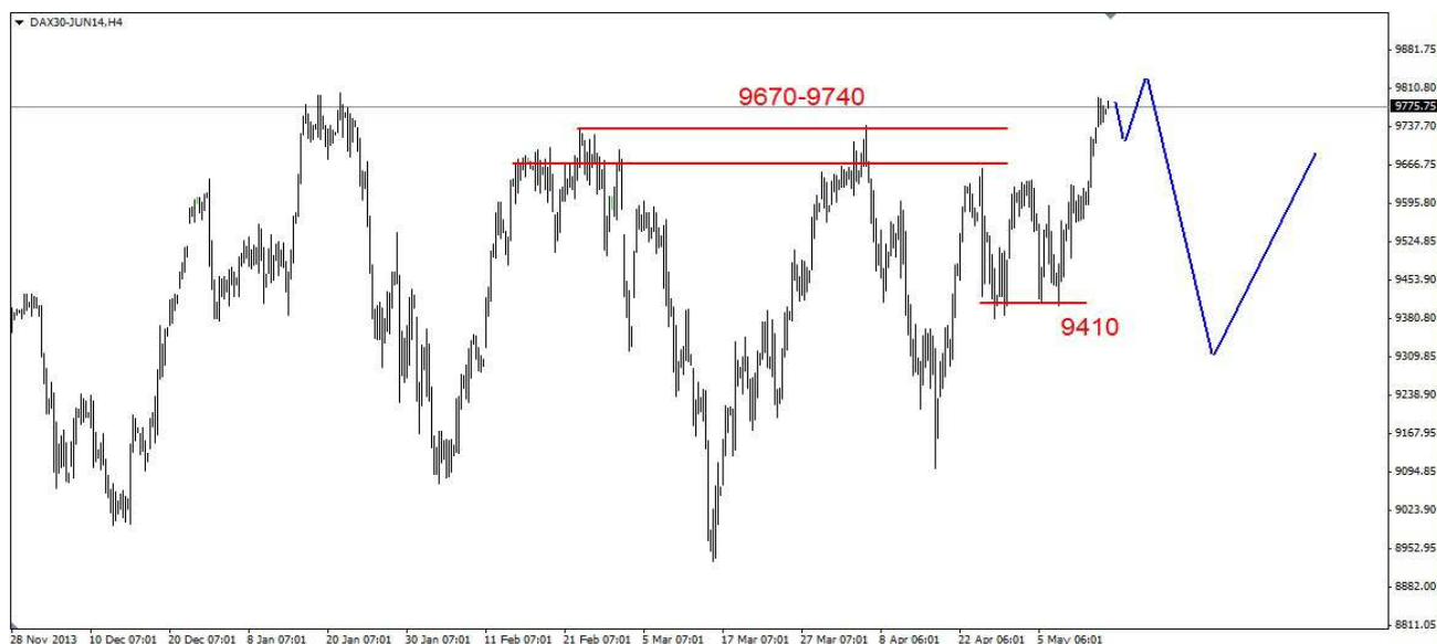
Wykres 3. Kontrakty CFD na indeks DAX

NIEMCY (Kontrakty DAX) We wtorek osiągnięty został szczyt na poziomie 9792pkt., po południu doszło do niewielkiego cofnięcia. Zamknięcie wypadło po 9774pkt. Obecnie kontrakty są notowane po 9776pkt. (wykres 3).