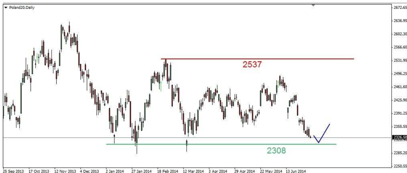
Wykres 1. Kontrakty na indeks WIG20

PROGNOZA Z lipcowego dna (2361pkt.) odbicie przyjęło postać tylko korekcyjnej trójki. W krótkim terminie być może czeka nas na rynku kasowym jeszcze test wsparcia w rejonie 2350pkt. Próba jego trwałego przełamania może się nie udać i w efekcie może dojść do trwalszego wielosesyjnego odbicia (wykres 1).