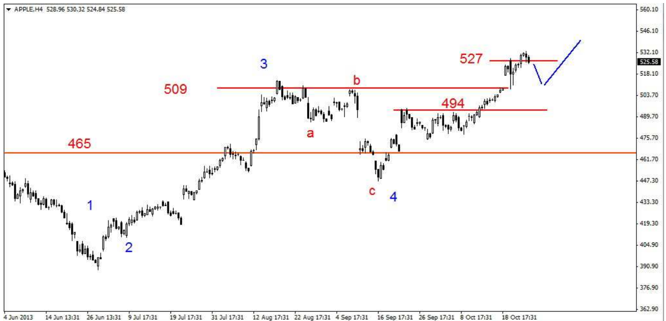
Wykres 3. Kontrakty CFD na spółkę Apple

PROGNOZA: W krótkim terminie oczekują na korekcyjny spadek (sygnał pojawi się po przełamaniu wsparcia w rejonie 527 USD). Wsparcie w rejonie 509 USD nie powinno być zagrożone (wykres 3). W dalszej perspektywie oczekują kolejnej fali wzrostów.