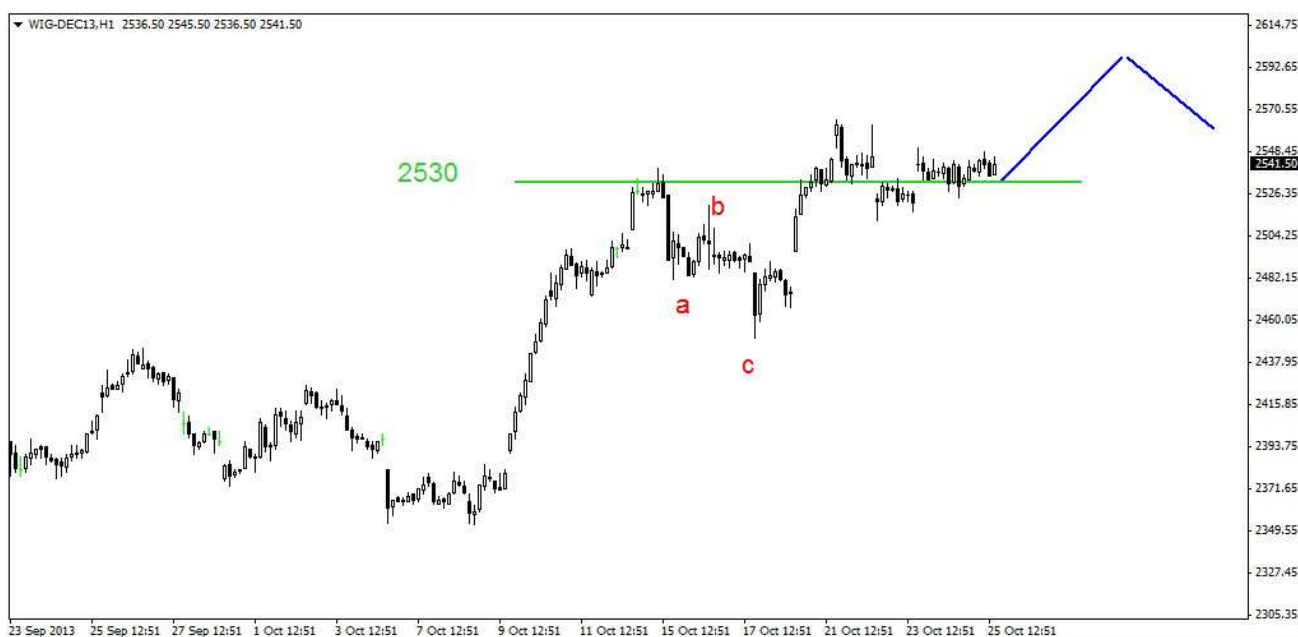
Wykres 1. Kontrakty na indeks WIG20 w układzie intraday

W krótkim terminie możliwe wybiecie w górę z 2-sesyjnej konsolidacji. W dalszej perspektywie oczekuję atak na szczyt sprzed kilku sesji (2567pkt.) co może otworzyć drogę do ataku na opór w rejonie 2600pkt. Próba jego przełamania może się nie udać i w efekcie możliwa będzie dłuższa wielosesyjna korekta (wykres 1).