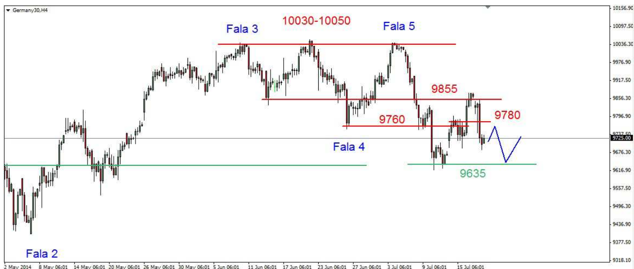
Wykres 4. Kontrakty CFD na indeks DAX

PROGNOZA: W krótkim terminie możliwe jest odbicie. Opór znajduje się w obszarze 9760-9780pkt. Próba jego przełamania nie powinna się udać. W dalszej perspektywie oczekuję powrotu na lipcowe minimum. Wsparcie znajduje się w rejonie 9635pkt. Próba przełamania tego wsparcia może się nie udać. W efekcie możliwe jest odbicie.