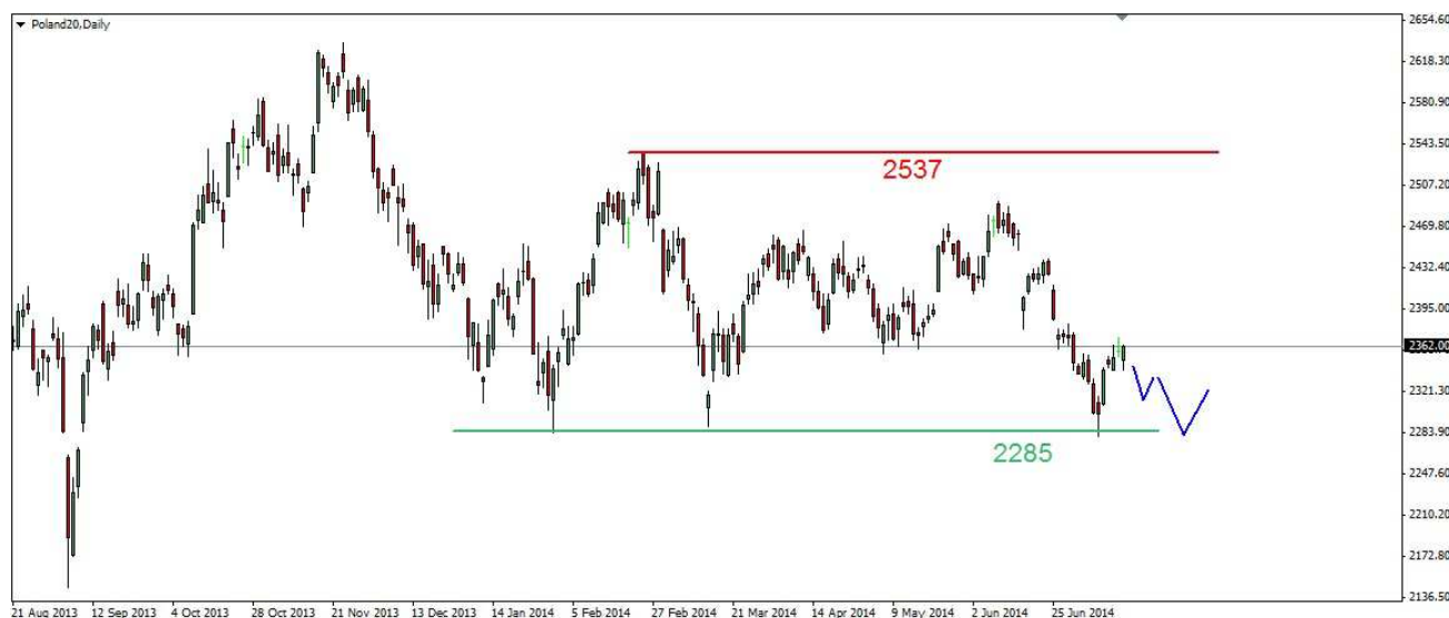
Wykres 1. Kontrakty na indeks WIG20

POLSKA (WIG20) Początek czwartkowej sesji przyniósł spadki. Dzienny dołek wypadł na poziomie 2379pkt. Po godzinie 14-tej doszło do odbicia. Zamknięcie na poziomie 2403pkt. PROGNOZA Pogorszenie się sytuacji na giełdach w USA powinno przełożyć się na spadki na naszym rynku. Dzisiejsza sesja może przynieść test wsparcia w rejonie 2372-2376pkt. (majowe dołki). W dalszej wielosesyjnej perspektywie możliwy jest powrót do lipcowego dna (wykres 1). Na rynku kasowym jest to poziom 2317pkt.