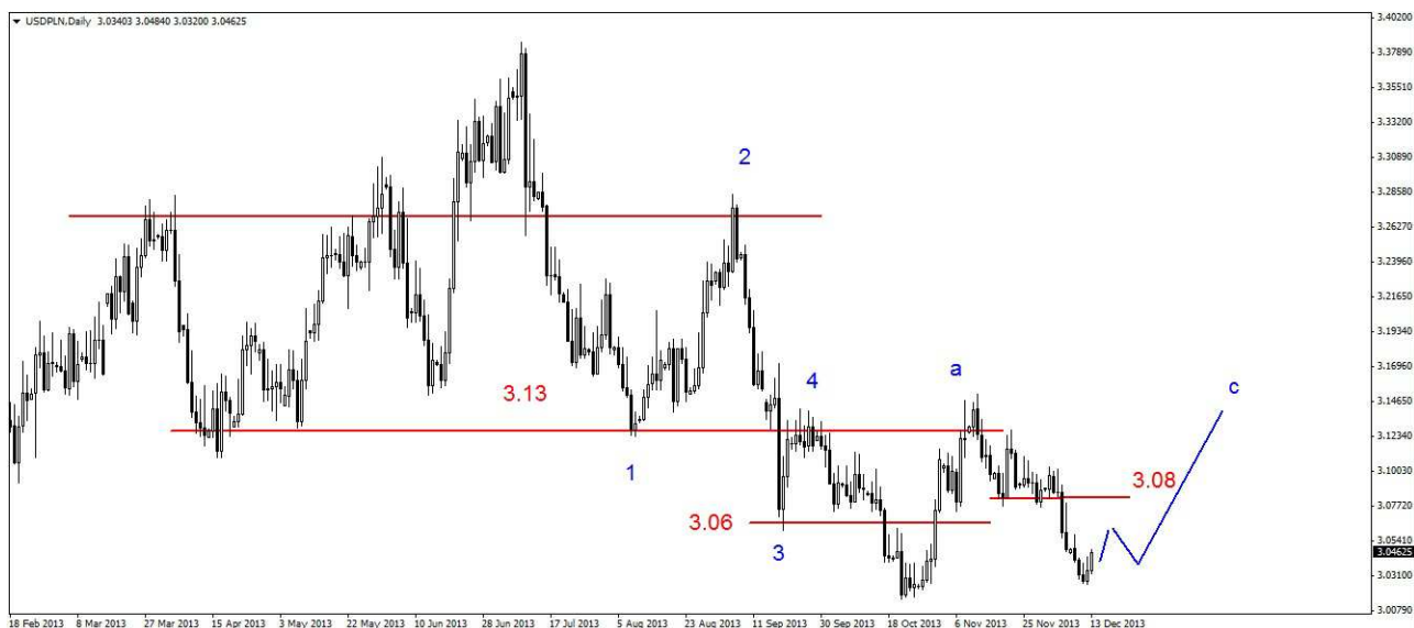
Wykres 3. Dolar amerykański w relacji do złotego (USD/PLN)

EUR/PLN – W czwartek osiągnięte zostało dno na poziomie 4.1701 PLN, zamknięcie wypadło na poziomie 4.1741 PLN. Dziś kurs euro wzrósł do 4.1848 PLN (szczyt z czwartku na poziomie 4.1865 PLN nie został przekroczony). Obecnie euro jest notowane po 4.1795 PLN. PROGNOZA: W krótkim terminie możliwe jest niewielkie odbicie, potem oczekuję na spadki do wsparcia w rejonie 4.16 PLN (wykres 4).