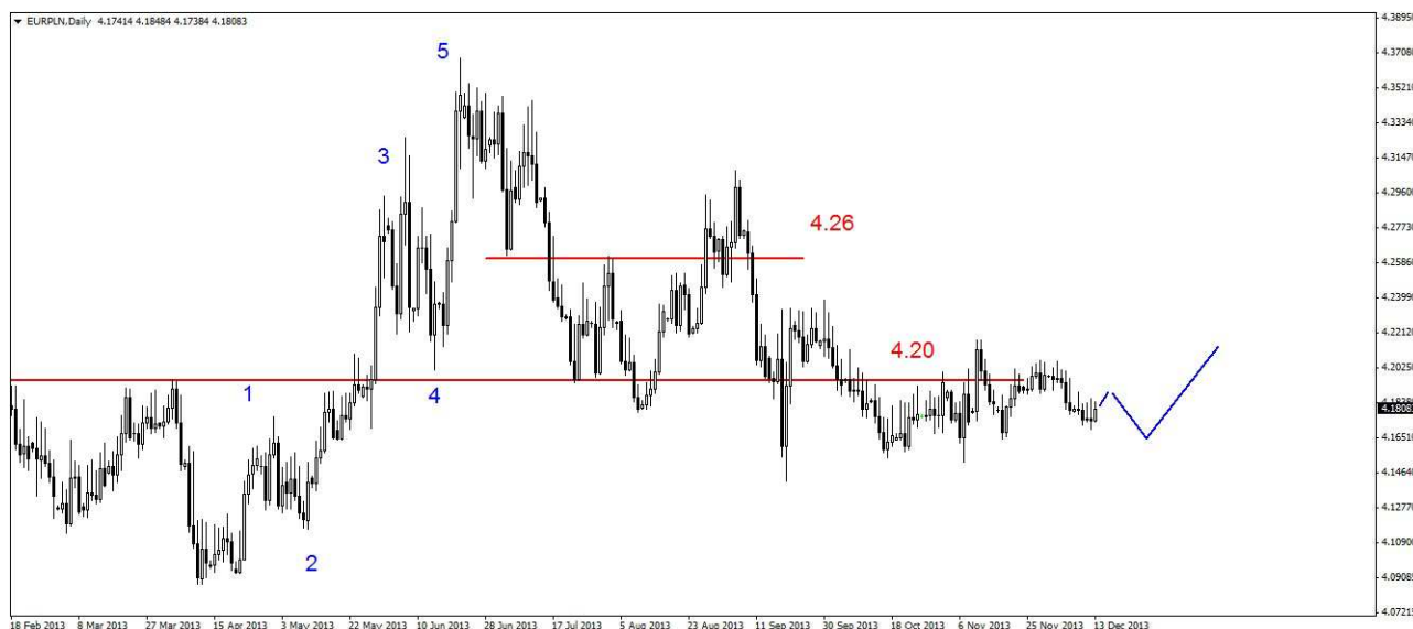
Wykres 4. Euro w relacji do złotego (EUR/PLN)

Kontrakty CFD na złoto – Z wtorkowego szczytu na poziomie 1266.80 USD doszło do spadków. W czwartek miały one dużą dynamikę. Dzielne minimum wypadło na poziomie 1223.60 USD, zamknięcie po 1224.50 USD. Dziś przed południem doszło do spadku do 1220.20 USD, obecnie kontrakty są notowane po 1225.40 USD. PROGNOZA: Tygodniowe odbicie z dna (1211 USD) jest w mojej ocenie falą czwartą. W ciągu najbliższych dni możliwe są spadki i pogłębienie dna na poziomie 1211 USD. To może skutkować powrotem w rejon tegorocznego dna na poziomie 1180 USD (wykres 5) i dopiero potem zobaczymy trwalsze wielosesyjne odbicie.