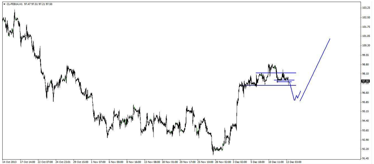
Wykres 6. Kontrakty CFD na ropę

PROGNOZA: W krótkim kilkusecyjnym możliwe są spadki. Wsparcie znajduje się w rejonie 95.50-96.00 USD (wykres 6). Po zakończeniu kilkusecyjnej korekty oczekuję dalszych silnych wzrostów (target 101-102 USD).