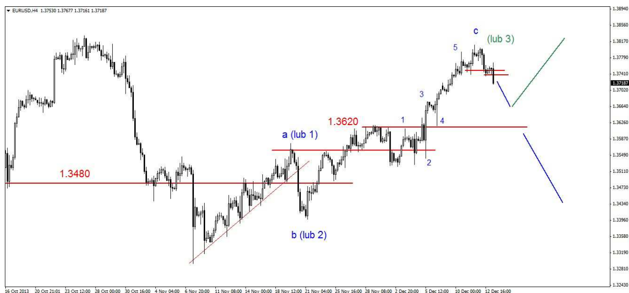
Wykres 1. Eurodolar w perspektywie krótkoterminowej

PROGNOZA (długi termin): Z lipcowego dna widoczna jest wzrostowa trójka wyższego rzędu (A-B-C). Krytyczne wsparcie w rejonie 1.3380-1.3400 USD zostało nieznacznie naruszone i nastąpiło bardzo silne odbicie (wykres 2). Wcześniej czy później powinno dojść do mocniejszego ruchu w dół. Krytyczne wsparcie znajduje się w rejonie 1.3620 USD. Rozbicie tego wsparcia wygeneruje sygnał do poważniejszej przeceny.