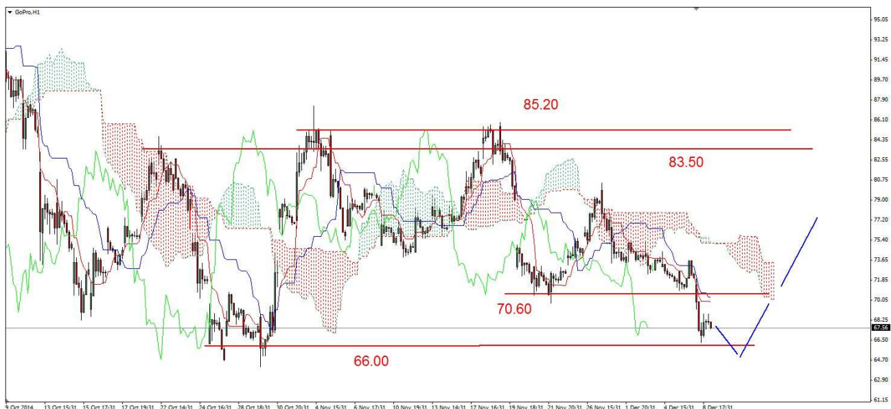
Wykres 3. Kontrakty CFD w układzie intraday

NIEMCY (Kontrakty DAX) W poniedziałek kontrakty wzrosły do nowego szczytu na poziomie 10102pkt. Próba przełamania szczytu z piątku (10099pkt.) nie udała się i doszło do spadków. Dienne dno wypadło na