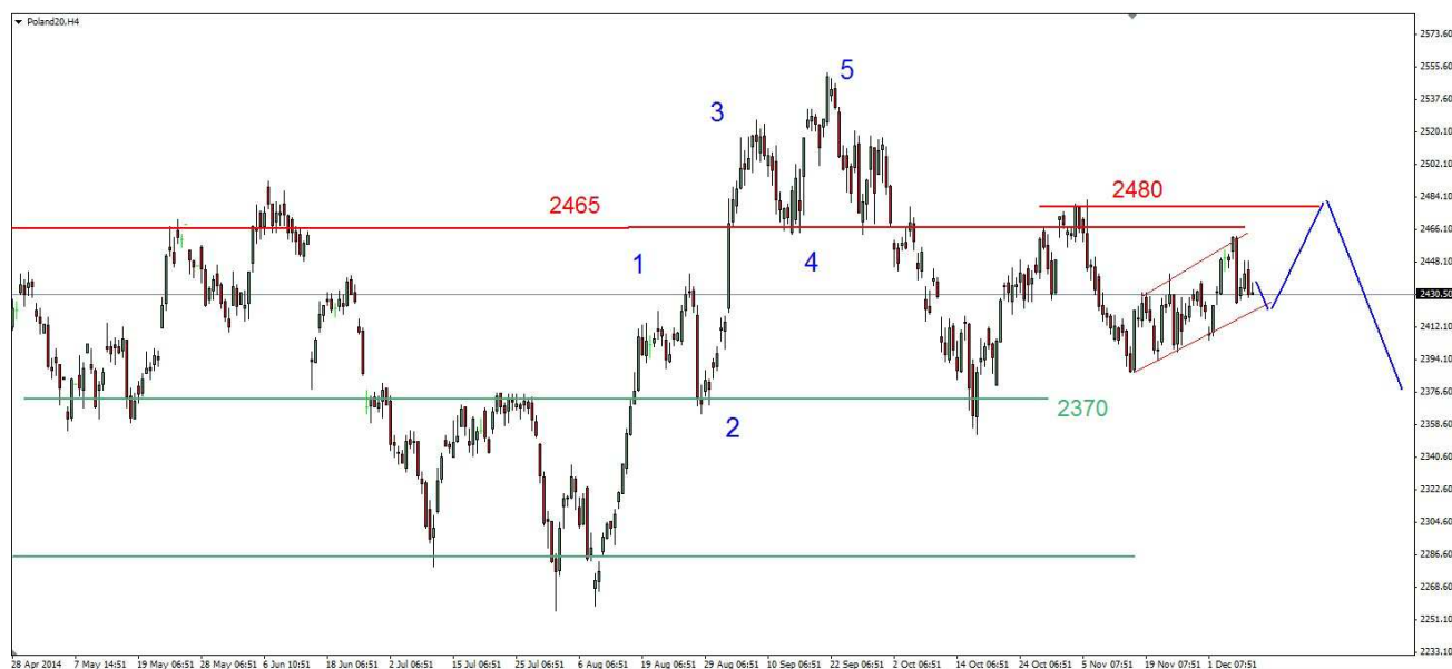
Wykres 1. Kontrakty na indeks WIG20

POLSKA (WIG20) Początek poniedziałkowej sesji przyniósł wzrost do poziomu 2448pkt. Przed godziną 10-tą rozpoczęła się realizacja zysków. Dzielne dno wypadło na poziomie 2426pkt. Po godzinie 11-tej rynek wkroczył w wielogodziną fazę konsolidacji. Zamknięcie wypadło na poziomie 2432pkt. PROGNOZA W krótkim terminie możliwy powrót do dolnego ograniczenia wielosecyjnego kanału trendowego. W dalszej wielosecyjnej perspektywie oczekuję wzrostu w okolicy 2480pkt. (wykres 1). W trzeciej dekadzie grudnia możliwe jest przesilenie.