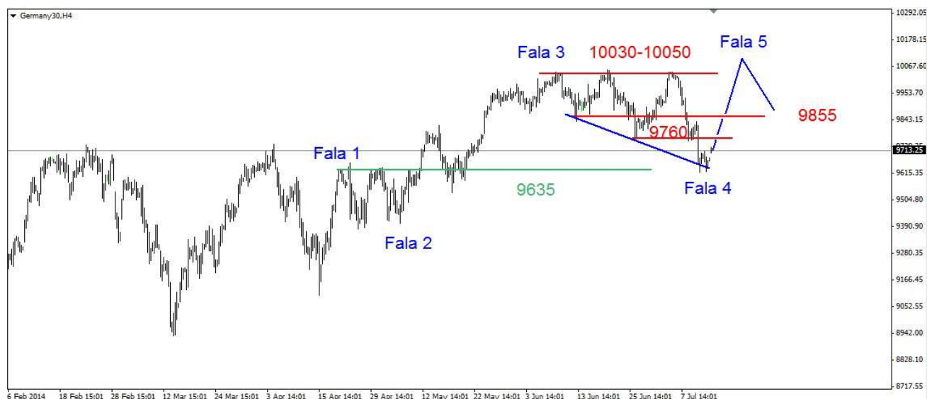
Wykres 4. Kontrakty CFD na indeks DAX

PROGNOZA: Sytuacja jest bardzo poważna. Naruszone zostało wsparcie w postaci szczytu sprzed kilku miesięcy. Do poprawy sytuacji konieczne jest przełamanie oporu w rejonie 9760pkt. Sądzę, że na początku tygodnia dojdzie do odbicia. Może się pojawić formacja podwójnego dna z targetem na poziomie 9780pkt.