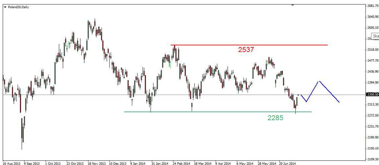
Wykres 1. Kontrakty na indeks WIG20

PROGNOZA W krótkim terminie możliwe jest odreagowanie spadków z czerwcowego szczytu. Silna bariera na wykresie indeksu WIG20 znajduje się w rejonie 2430pkt. W mojej ocenie jest ona poza zasięgiem popytu. Po lipcowym przesileniu na giełdach w USA możliwa jest kolejna fala spadków. Wtedy może dojść do testowania tegorocznego dna na poziomie 2280pkt. (wykres 1) Próba trwałego rozbicia tego wsparcia nie powinna się udać, co może skutkować kilkutygodniową falą wzrostów.