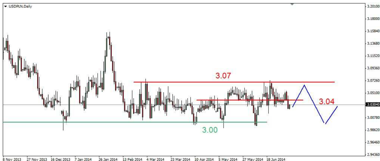
Wykres 4. Dolar amerykański w relacji do złotego (USD/PLN)

Kontrakty CFD na złoto We wtorek kurs złota wzrósł do 1325.70 USD, po południu nastąpiła realizacja zysków. Dzielne dno wypadło na poziomie 1314.40 USD, zamknięcie po 1320.50 USD. Dziś rano kurs złota wzrósł do 1327.00 USD, obecnie złoto jest notowane po 1324.40 USD (wykres 5). PROGNOZA: Sytuacja w średnim terminie pozostaje bez zmian. Trwająca wiele sesji konsolidacja po silnych wzrostach i w rejonie silnego oporu z połowy kwietnia (1326-1331 USD) ma duże szanse zakończyć się wybiciem w dół. Pierwszą oznaką słabości popytu będzie przebicie wsparcia w rejonie 1319 USD. To powinno otworzyć drogę do wsparcia w rejonie 1307 USD. Rozbite tego wsparcia wygeneruje sygnał do spadku w okolice 1290 USD i być może jeszcze niżej.