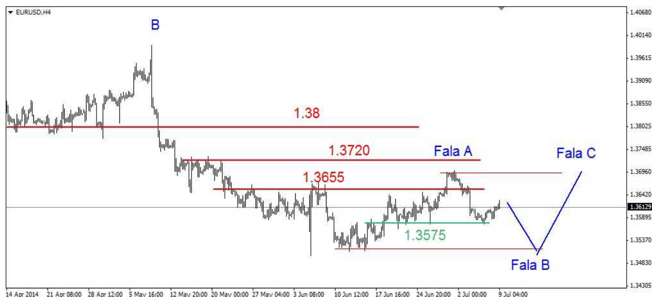
Wykres 1. Eurodolar w perspektywie krótkoterminowej

GBP/USD We wtorek o 10:30 pojawiły się gorsze dane z Wielkiej Brytanii. Przełożyły się one na spadek funta do poziomu 1.7085 USD. Dostyc szybko rozpoczęło się odrabianie strat. Zamknięcie na poziomie 1.7129 USD. Dziś rano kurs funta wzrósł do 1.7145 USD, obecnie funt jest notowany po 1.7130 USD (wykres 2). PROGNOZA: Przebicie oporu w rejonie 1.7107-1.7117 USD generuje sygnał do powrotu na szczyt z poprzedniego tygodnia (1.7179 USD). Może on zostać nieznacznie przekroczony. Próba przełamania oporu na poziomie 1.72 USD. Może się nie udać i w efekcie możliwy wielosesyjny ruch w dół. Krytyczne średnioterminowe wsparcie znajduje się w okolicy 1.6980 USD.