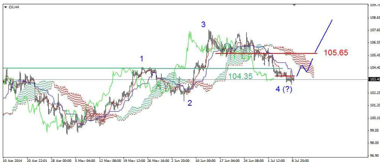
Wykres 6. Kontrakty CFD na ropę

PROGNOZA: Przekroczenie krytycznego wsparcia na poziomie 104.35 USD to jest poważny sygnał i jednocześnie problem jak oznaczyć fale. Krótkoterminowy opór znajduje się w rejonie 103.64-103.67 USD. Przebicie tej bariery oraz szczytu z wtorku (104.12 USD) może wygenerować krótkoterminowy sygnał do odbicia. Poprawa sytuacji nastąpi po powrocie powyżej 104.35 USD. Do gry na długo (perspektywa kilku sesji) konieczne będzie jednak przebicie oporu w okolicy 105.65 USD. Wtedy można zakładać powrót na czerwcowy szczyt (107.67 USD) a w dalszej perspektywie jego niewielkie przekroczenie.