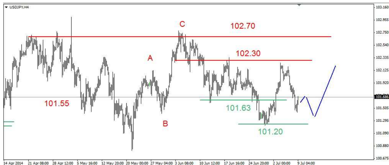
Wykres 3. Dolar amerykański w relacji do jena (USD/JPY)

USD/PLN We wtorek doszło do sporego spadku. Minimum wypadło na poziomie 3.0253 PLN, zamknięcie blisko dna po 3.0267 PLN. Obecnie dolar jest notowany po 3.0295 PLN (wykres 4). PROGNOZA: W krótkim kilkusecyjnym terminie możliwe jest korekcyjne odbicie i atak na opór w rejonie 3.07 PLN. Nie powinien zostać przeбит. W dalszej kilkutygodniowej perspektywie możliwy jest nawet powrót do dolnego ograniczenia kilkumiesięcznej fazy konsolidacji (3.00-3.07 PLN).