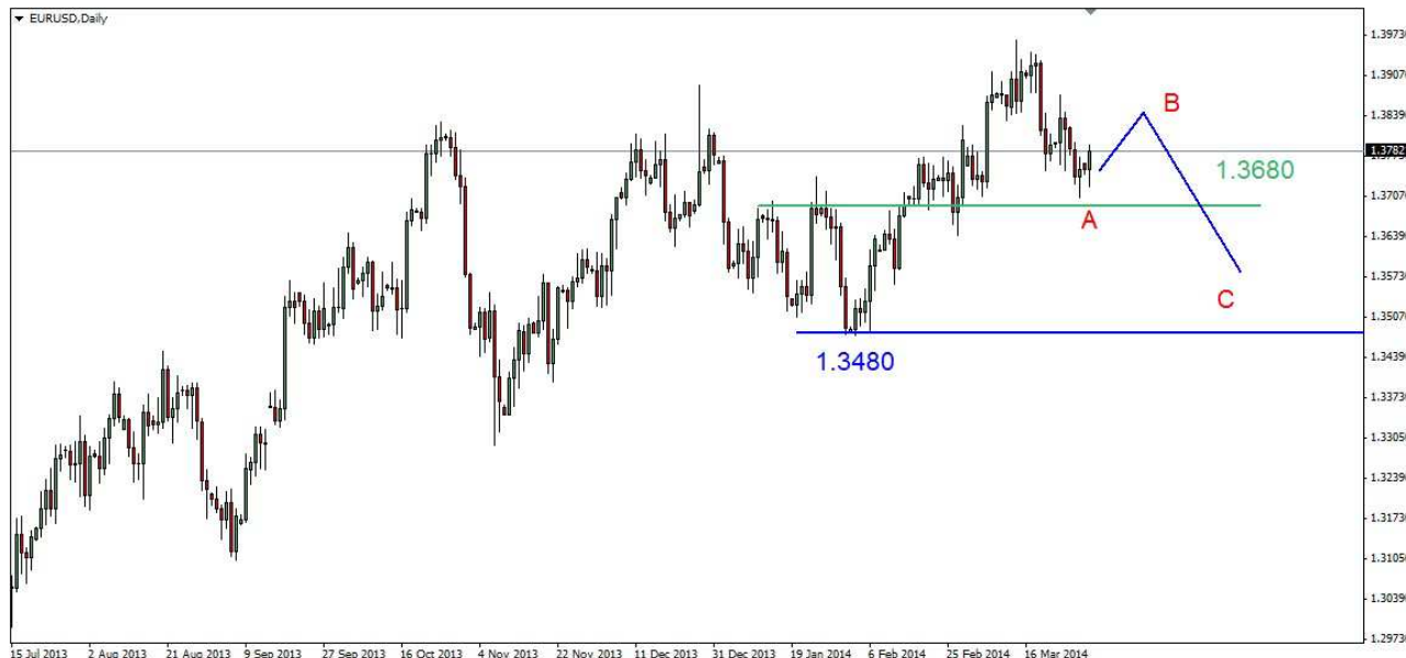
Wykres 2. Eurodolar w perspektywie średnioterminowej

USD/PLN W piątek doszło do wzrostów. Dienne maksimum wypadło na poziomie 3.0401 PLN, zamknięcie nisko po 3.0266 PLN. Obecnie dolar jest notowany po 3.0250 PLN (wykres 3). PROGNOZA: W krótkim kilkusecyjnym terminie (wzrostowa korekta na eurodolarze) możliwy ruch w dół do wsparcia w rejonie 3.00-3.01 PLN. Próba przebicia tego wsparcia nie powinna się udać. Gdy rozpocznie się kolejny ruch w dół na eurodolarze możliwy jest powrót do oporu w 3.07-3.08 PLN.