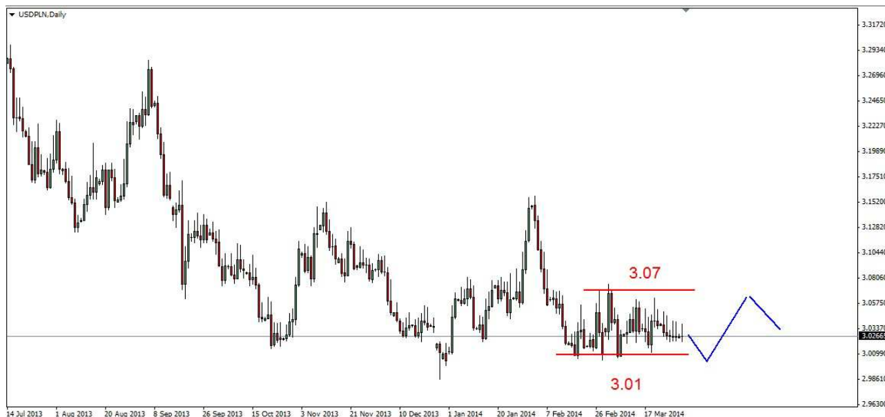
Wykres 3. Dolar amerykański w relacji do złotego (USD/PLN)

USD/PLN W piątek doszło do wzrostów. Dienne maksimum wypadło na poziomie 3.0401 PLN, zamknięcie nisko po 3.0266 PLN. Obecnie dolar jest notowany po 3.0250 PLN (wykres 3). PROGNOZA: W krótkim kilkusecyjnym terminie (wzrostowa korekta na eurodolarze) możliwy ruch w dół do wsparcia w rejonie 3.00-3.01 PLN. Próba przebicia tego wsparcia nie powinna się udać. Gdy rozpocznie się kolejny ruch w dół na eurodolarze możliwy jest powrót do oporu w 3.07-3.08 PLN.