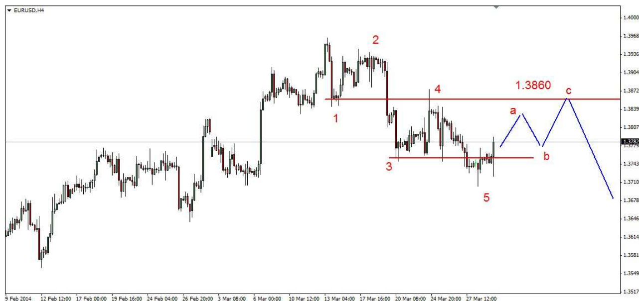
Wykres 1. Eurodolar w perspektywie krótkoterminowej

PROGNOZA (długi termin): Z marcowego szczytu widoczna jest spadkowa piątka może ona tworzyć falę A. Po jej zakończeniu możliwa jest już tylko kilkusecyjna korekta (fala B). Po jej zakończeniu oczekuję kolejnej