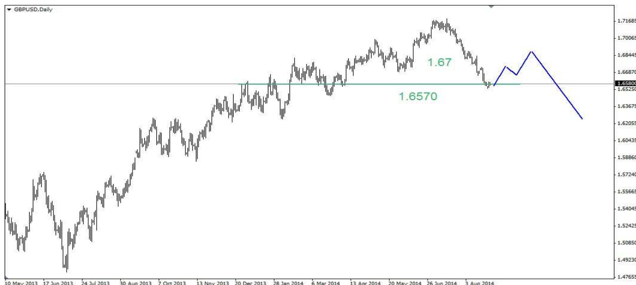
Wykres 2. Funt w relacji do dolara (GBP/USD)

USD/JPY W poniedziałek w nocy osiągnięty został kolejny szczyt na poziomie 104.27 JPY, po kilkugodzinnej nocnej konsolidacji doszło do wybicia w dół. Dzielne dno wypadło na poziomie 103.86 JPY, zamknięcie po 104.04 JPY. Obecnie dolar jest notowany po 103.88 JPY (wykres 3). PROGNOZA: W krótkim terminie oczekuję na realizację zysków. Wsparcie znajduje się w rejonie 103.0 JPY.