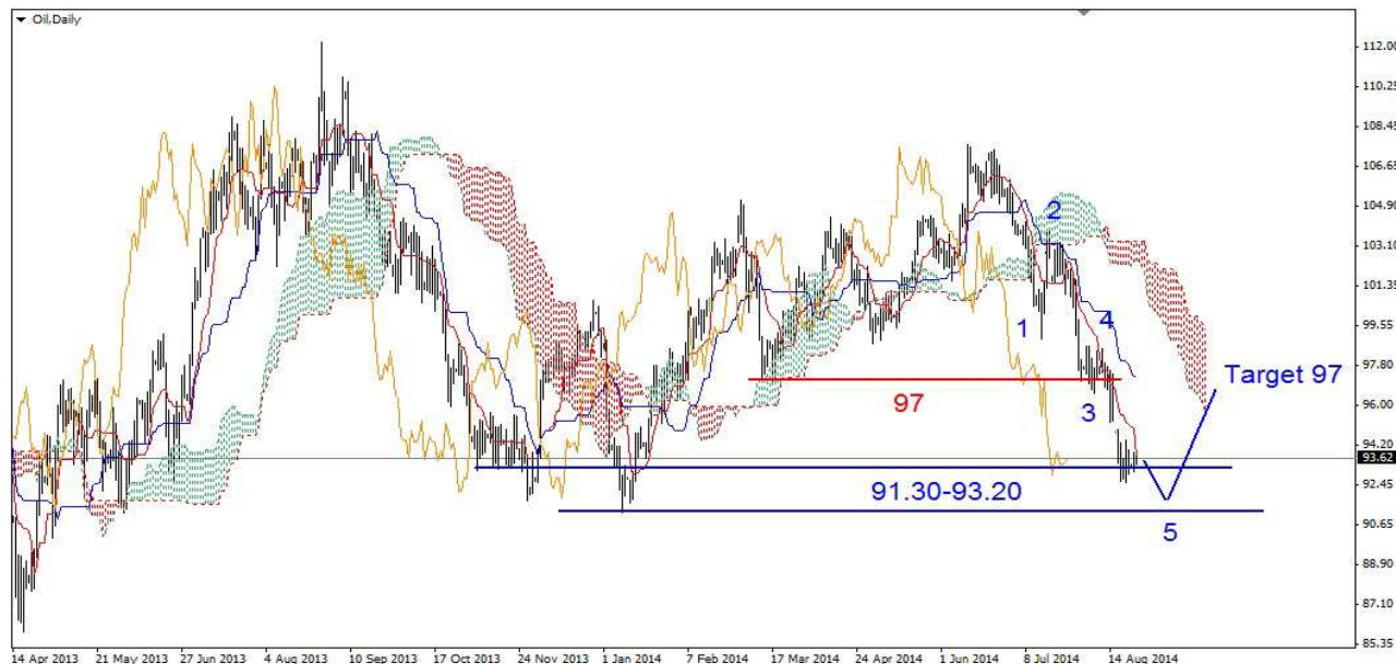
Wykres 6. Kontrakty CFD na ropę

PROGNOZA: W ciągu kilku sesji możliwy jest powrót do wsparć w postaci dna z wtorku (92.66 USD) i czwartku (92.63 USD). Próba ich trwałego przełamania nie powinna się udać. W dalszej perspektywie może dojść do przesilenia i wtedy liczyć na rozpoczęcie się mocniejszego wielosesyjnego odbicia. Może ono znieść np. 38% spadków z tegorocznego szczytu. Dawałoby to zasięg odbicia w okolice 97 USD.