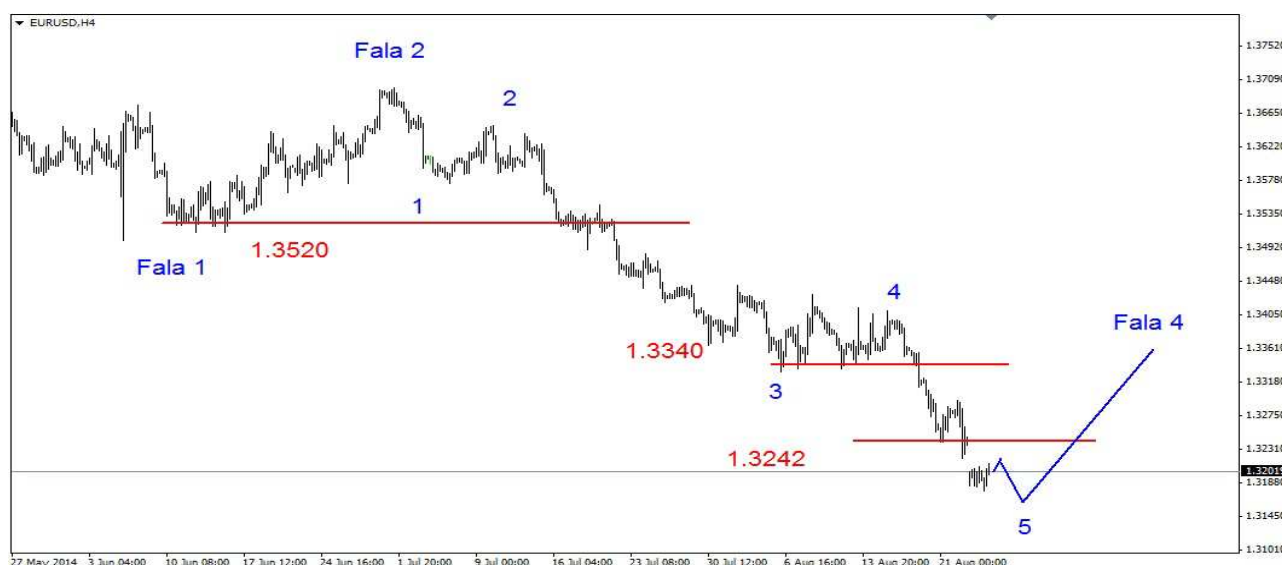
Wykres 1. Eurodolar w perspektywie średnioterminowej

GBP/USD Po 2-sesyjnej konsolidacji w poniedziałek w nocy doszło do wybicia w dół. Dołek wypadł na poziomie 1.6539 USD. Szybko rozpoczęło się silne odbicie. Dzielne maksimum wypadło na poziomie 1.6598