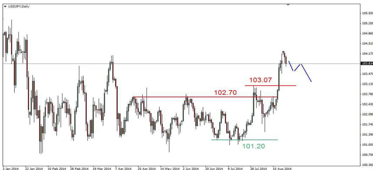
Wykres 3. Dolar amerykański w relacji do jena (USD/JPY)

USD/PLN W poniedziałek w nocy osiągnięty został nowy szczyt na poziomie 3.1709 PLN, w ciągu dnia doszło do spadku do 3.1605 PLN, zamknięcie po 3.1682 PLN. Obecnie dolar jest notowany po 3.1685 PLN. PROGNOZA: W poniedziałek mogło dojść do przesilenia. Przebicie wsparcia w rejonie 3.1590 PLN