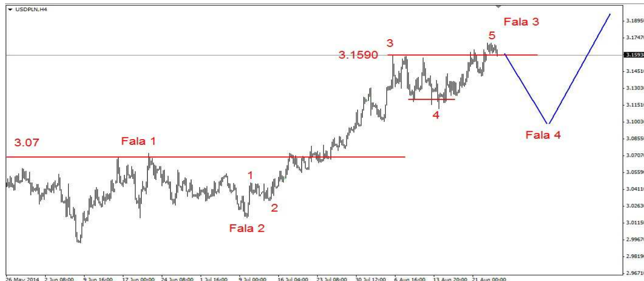
Wykres 4. Dolar amerykański w relacji do złotego (USD/PLN)

Kontrakty CFD na złoto Po piątkowej nieudanej próbie przebicia oporu w postaci dna z początku sierpnia (1280 USD) w poniedziałek kurs złota spadł. Dienne dno wypadło na poziomie 1274.28 USD, zamknięcie po 1276.52 USD. We wtorek rano kurs złota silnie wzrósł do 1290.61 USD, obecnie złoto jest notowane po 1288.87 USD (wykres 5). PROGNOZA: Powrót powyżej ważnego oporu (1282 USD) może być pułapką. Będzie tak jeśli nie uda się pokonać bariery w okolicy 1294 USD. Wtedy grozi nam jeszcze powrót na sierpniowe dno i niżej.