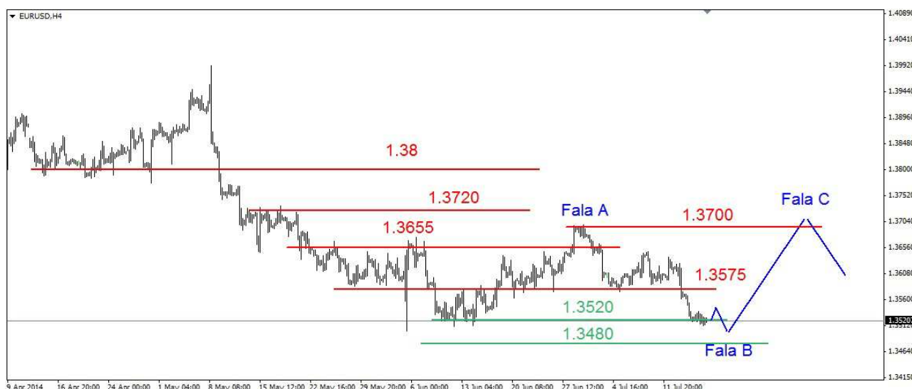
Wykres 1. Eurodolar w perspektywie krótkoterminowej

GBP/USD Z wtorkowego maksimum na poziomie 1.7192 USD doszło do spadków. W czwartek kurs funta spadł do 1.7085 USD. Zamknięcie wypadło na poziomie 1.7101 USD. Dziś w nocy kurs funta spadł do 1.7083