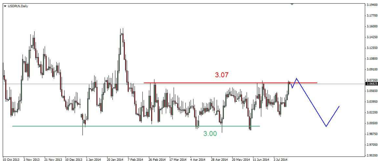
Wykres 4. Dolar amerykański w relacji do złotego (USD/PLN)

Kontrakty CFD na złoto Z wtorkowego dna na poziomie 1293.20 USD doszło do odbicia. W czwartek dotarło ono do 1324.30 USD, zamknięcie po 1318.80 USD. Obecnie złoto jest notowane po 1313.60 USD (wykres 5). PROGNOZA: Z czwartkowego szczytu (1345.70 USD) do wtorkowego dna pojawiła się 5-falowa struktura. Dwusesyjne odbicie jest w mojej ocenie korekcyjne. Kolejne sesje mogą przynieść jeszcze jeden ruch w dół. Z lipcowego szczytu powinna się pojawić tylko spadkowa korekcyjna trójka. W dalszej kilkutygodniowej perspektywie możliwy kolejny ruch w górę w rejon marcowego szczytu (1390 USD).