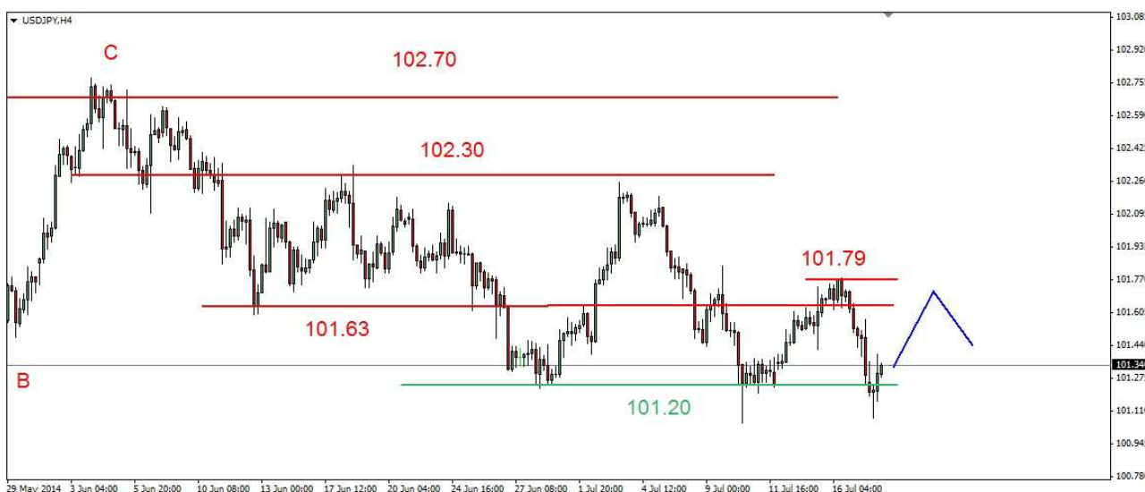
Wykres 3. Dolar amerykański w relacji do jena (USD/JPY)

USD/PLN W czwartek kurs dolara wzrósł do 3.0725 PLN, zamknięcie po 3.0691 PLN. Obecnie dolar jest notowany po 3.0665 PLN (wykres 4). PROGNOZA: W krótkim terminie na dzisiejszej sesji możliwe jest korekcyjne cofnięcie, potem możliwy jest kolejny atak na barierę w rejonie 3.07 PLN. Próba trwałego przełamania tego silnego oporu nie powinna się udać. W dalszej kilkutygodniowej perspektywie możliwy jest nawet powrót do dolnego ograniczenia kilkumiesięcznej fazy konsolidacji (3.00-3.07 PLN).