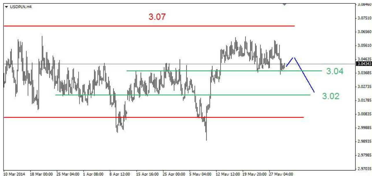
Wykres 4. Dolar amerykański w relacji do złotego (USD/PLN)

Kontrakty CFD na złoto W czwartek rano doszło do spadku do poziomu 1251.60 USD. Po godzinie 10-tej rozpoczęło się odrabianie strat. Dzienny szczyt wypadł na poziomie 1260.40 USD. Zamknięcie wypadło na poziomie 1255.50 USD. Dziś w nocy kurs złota wzrósł do 1260.60 USD, obecnie złoto jest notowane po 1258.10 USD (wykres 5). PROGNOZA: Wczoraj doszło do naruszenia oporu w rejonie 1256.20 USD. Prawdopodobnie więc złoto nie spadnie do nowego dołka i można zaryzykować stwierdzenie, że w czwartek rozpoczęło się odrabianie strat. Odbicie na eurodolarze (jeśli wystąpi) może wspomóc popyt. Odbicie może nas zaprowadzić do oporu w rejonie 1270 USD.