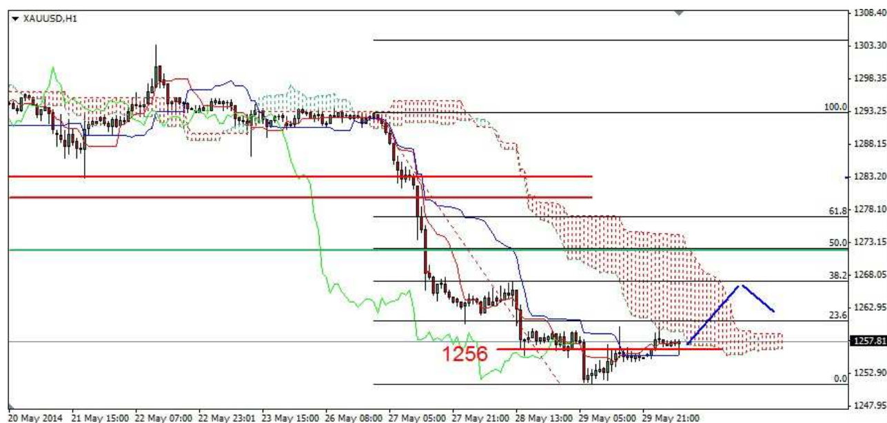
Wykres 5. Kontrakty CFD na złoto

Kontrakty CFD na złoto W czwartek rano doszło do spadku do poziomu 1251.60 USD. Po godzinie 10-tej rozpoczęło się odrabianie strat. Dzienny szczyt wypadł na poziomie 1260.40 USD. Zamknięcie wypadło na poziomie 1255.50 USD. Dziś w nocy kurs złota wzrósł do 1260.60 USD, obecnie złoto jest notowane po 1258.10 USD (wykres 5). PROGNOZA: Wczoraj doszło do naruszenia oporu w rejonie 1256.20 USD. Prawdopodobnie więc złoto nie spadnie do nowego dołka i można zaryzykować stwierdzenie, że w czwartek rozpoczęło się odrabianie strat. Odbicie na eurodolarze (jeśli wystąpi) może wspomóc popyt. Odbicie może nas zaprowadzić do oporu w rejonie 1270 USD.