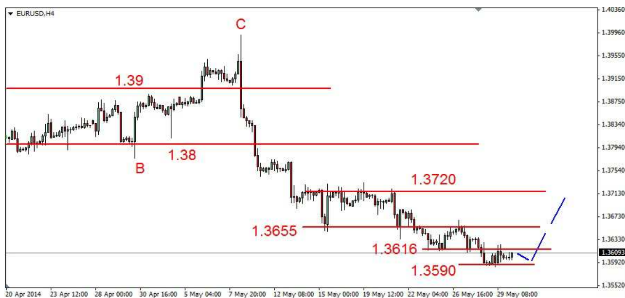
Wykres 1. Eurodolar w perspektywie krótkoterminowej

GBP/USD W czwartek rano nie udało się próba przebiccia dna ze środy (1.6698 USD). Z dna na poziomie 1.6692 USD doszło do odbicia do 1.3740 USD. Próba przełamania oporu w rejonie 1.6735 USD nie powiodła się. Zamknięcie po 1.6716 USD. Dziś rano doszło do wzrostu do 1.6758 USD, obecnie funt jest notowany po