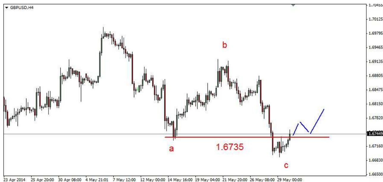
Wykres 2. Funt w relacji do dolara (GBP/USD)

USD/JPY W czwartek doszło do spadku do 101.43 JPY. Po południu nastąpiło odbicie. Zamknięcie po 101.73 JPY. Dziś rano doszło do spadku do 101.50 JPY. Obecnie dolar jest notowany po 101.66 JPY (wykres 3). PROGNOZA: W krótkim terminie możliwe korekcyjne odbicie, potem jeszcze jeden ruch w dół i po nieudanej próbie przełamania dna z czwartku możliwy kolejny kilkusecyjny ruch w górę do silnego oporu w rejonie 102.70 JPY.