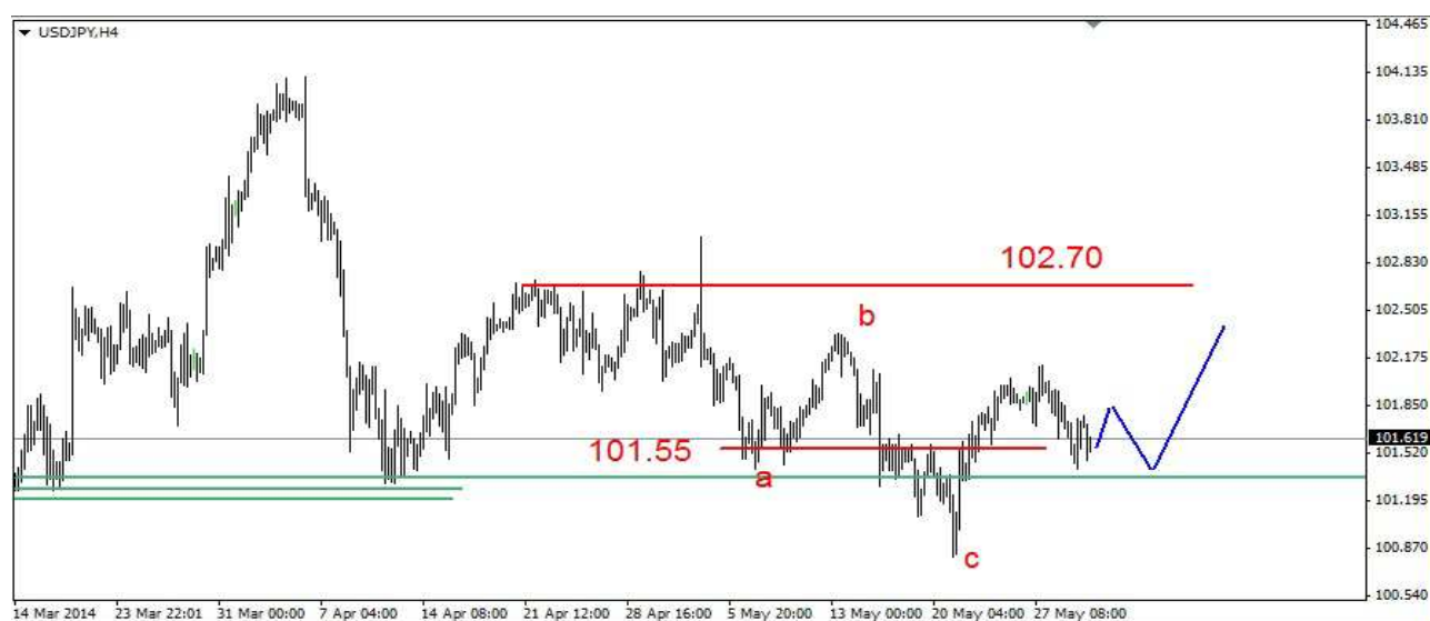
Wykres 3. Dolar amerykański w relacji do jena (USD/JPY)

USD/PLN W czwartek przed południem doszło do spadku do 3.0357 PLN, potem nastąpiło odbicie. Zamknięcie wypadło po 3.0393 PLN. Obecnie dolar jest notowany po 3.0432 PLN (wykres 4). PROGNOZA: W