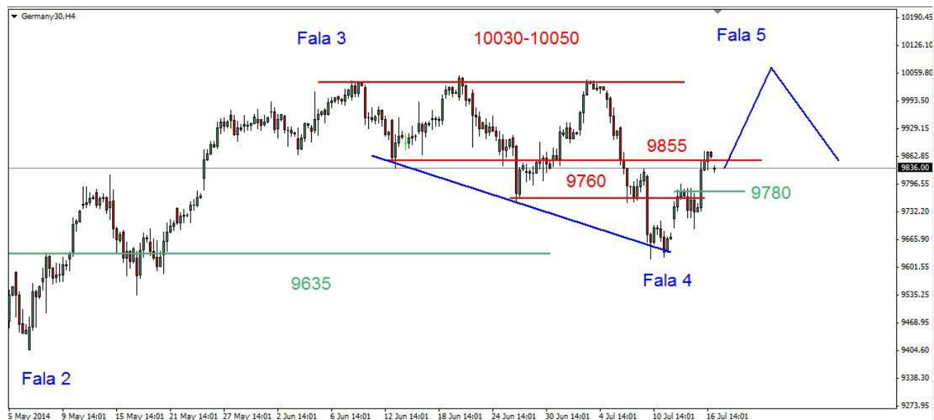
Wykres 4. Kontrakty CFD na indeks DAX

PROGNOZA: W krótkim terminie możliwa jest lokalna korekta. Ważne wsparcie znajduje się w rejonie 9780pkt. Jeśli rynek ma dalej rosnać wsparcie to nie może zostać przekroczone. Do dalszej poprawy sytuacji konieczne jest trwałe przełamanie oporu w rejonie 9855pkt. W dalszej perspektywie po przebiciu tego oporu otworzy się droga na tegoroczny szczyt (10050pkt.). Może on zostać nieznacznie przekroczony, potem czeka nas przesilenie.