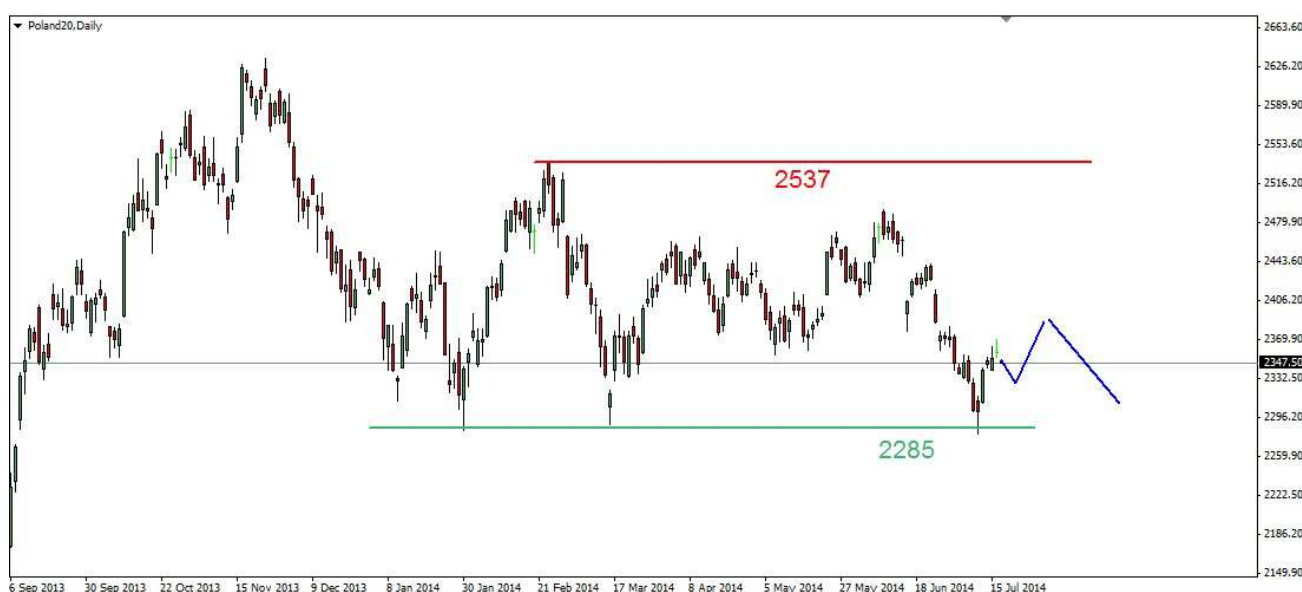
Wykres 1. Kontrakty na indeks WIG20

POLSKA (WIG20) Początek śródowej sesji przyniósł wzrosty. Kilkuseyjny szczyt wypadł na poziomie 2404pkt. Po godzinie 13-tej doszło do niewielkiego spadku. Zamknięcie wypadło na poziomie 2397pkt. PROGNOZA Rynek dosyć mocno odreagował wcześniejsze kilkutygodniowe spadki. Z lipcowego dna indeks zyskał blisko 90 punktów. Silny opór znajduje się w rejonie 2400pkt. Ryzyko wystąpienia realizacji zysków w postaci lokalnej korekty jest wysokie. Wsparcie znajduje się w rejonie 2372-2376pkt. (majowe dołki). Ruch w dół może być korekcyjny, potem oczekuję jeszcze jednego ruchu na północ (wykres 1). Opór znajduje się w okolicy 2400pkt., kolejna bariera znajduje się w rejonie 2430pkt. Próba jego przebicia może się nie udać i po przesileniu na giełdach w USA możliwy powrót na lipcowe dno (2317pkt.).