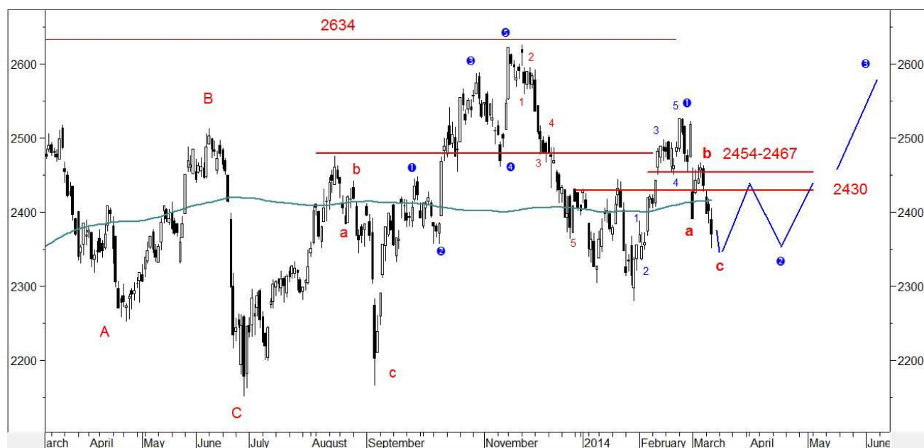
Wykres 1. Indeks WIG20

Na trwalsze wzrosty będziemy musieli poczekać na uspokojenie sytuacji geopolitycznej (w niedzielę nielegalne referendum na Krymie i potem zobaczymy jaka będzie decyzja Rosji). Po zakończeniu kilkutygodniowej korekty oczekuję na kolejną kilkutygodniową falę wzrostów w trakcie której indeks WIG20 powinien wrócić na szczyt z 2013 roku (wykres 1).