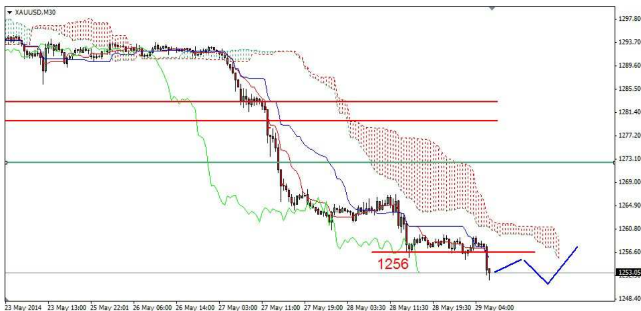
Wykres 5. Kontrakty CFD na złoto

Kontrakty CFD na złoto Po wtorkowych silnych spadkach. W środę doszło do odbicia. Lokalny szczyt wypadł na poziomie 1266.70 USD. Po południu doszło do dalszych spadków. Kolejne minimum wypadło na poziomie 1256.20 USD. Po godzinie 17:30 rozpoczęło się odbicie. Zamknięcie po 1258.90 USD. Dziś w nocy kurs złota spadł do kolejnego dna na poziomie 1251.90 USD. Obecnie złoto jest notowane po 1253.70 USD (wykres 5). PROGNOZA: W krótkim kilkugodzinnym terminie możliwe jest odbicie. Ważny krótkoterminowy opór znajduje się w rejonie 1256.20 USD. Jeśli nie uda się go pokonać to możliwy jest jeszcze jeden dołek. Wtedy z poziomu 1267 USD zobaczymy spadkową 5-tkę. Możliwe będzie odreagowanie kilkusecyjnych silnych spadków. Ważny opór znajduje się w rejonie 1270 USD.