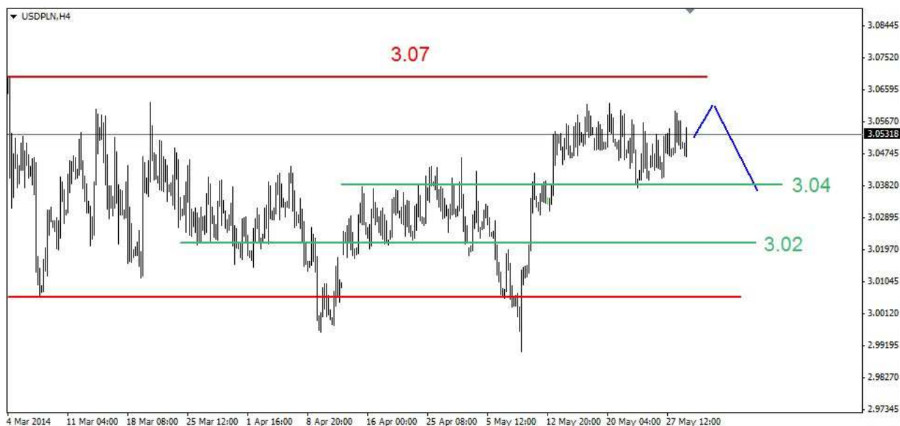
Wykres 4. Dolar amerykański w relacji do złotego (USD/PLN)

Kontrakty CFD na złoto Po wtorkowych silnych spadkach. W środę doszło do odbicia. Lokalny szczyt wypadł na poziomie 1266.70 USD. Po południu doszło do dalszych spadków. Kolejne minimum wypadło na poziomie 1256.20 USD. Po godzinie 17:30 rozpoczęło się odbicie. Zamknięcie po 1258.90 USD. Dziś w nocy kurs złota spadł do kolejnego dna na poziomie 1251.90 USD. Obecnie złoto jest notowane po 1253.70 USD (wykres 5). PROGNOZA: W krótkim kilkugodzinnym terminie możliwe jest odbicie. Ważny krótkoterminowy opór znajduje się w rejonie 1256.20 USD. Jeśli nie uda się go pokonać to możliwy jest jeszcze jeden dołek. Wtedy z poziomu 1267 USD zobaczymy spadkową 5-tkę. Możliwe będzie odreagowanie kilkusecyjnych silnych spadków. Ważny opór znajduje się w rejonie 1270 USD.