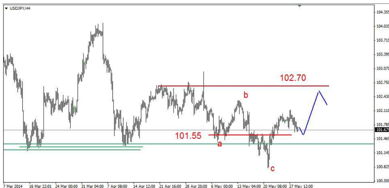
Wykres 3. Dolar amerykański w relacji do jena (USD/JPY)

USD/PLN Wczoraj przed południem kurs dolara wzrósł do 3.0593 PLN, potem doszło do cofnięcia. Zamknięcie wypadło po 3.0525 PLN. Dziś doszło do wzrostu do 3.0560 PLN, obecnie dolar jest notowany po 3.0496 PLN (wykres 4). PROGNOZA: W krótkim kilkusecyjnym terminie oczekuję na spadki. Wsparcie znajduje się w rejonie 3.04 PLN i kolejne znajduje się w obszarze 3.0200-3.0250 PLN.