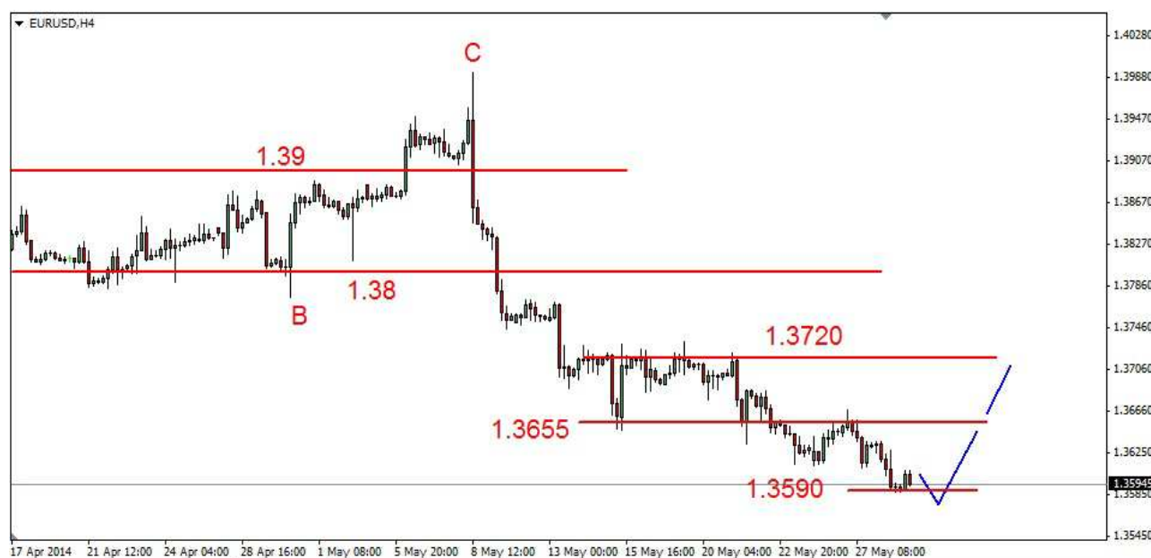
Wykres 1. Eurodolar w perspektywie krótkoterminowej

GBP/USD W środę doszło do dalszych spadków. Dzielne dno wypadło na poziomie 1.6698 USD. Zamknięcie blisko dna po 1.6711 USD. Dziś rano doszło do spadku do 1.6692 USD, obecnie funt jest notowany po 1.6705 USD (wykres 2). PROGNOZA: Przekroczony został dołek z poprzedniego tygodnia. Wyznacza on ważny opór w rejonie 1.6735 USD. Przebicie tej bariery od dołu może zakończyć blisko tygodniowy ruch w dół na funcie. W przeciwnym wypadku możliwe są dalsze spadki.