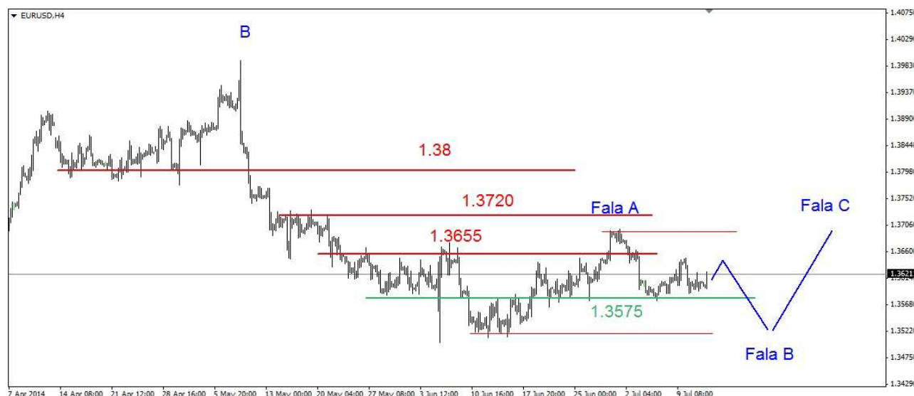
Wykres 1. Eurodolar w perspektywie krótkoterminowej

GBP/USD Od ponad tygodnia funt znajduje się w fazie konsolidacji. W piątek doszło do spadków. Dienne dno wypadło na poziomie 1.7099 USD, zamknięcie po 1.7119 USD. Obecnie funt jest notowany po 1.7124 USD (wykres 2). PROGNOZA: W kilkusecyjnej perspektywie (podobnie jak na eurodolarze) możliwe są spadki. Wybicie w dół z fazy konsolidacji może być kontynuacją korekcyjnej fali 4-tej. W dalszej perspektywie możliwy jeszcze jeden szczyt (wtedy gdy eurodolar wróci na 1.37 USD) w ramach fali piątej. W