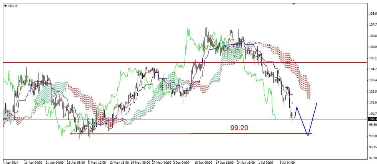
Wykres 6. Kontrakty CFD na ropę

PROGNOZA: Ze szczytu z wtorku na poziomie 104.12 USD do dzisiejszego dna (100.27 USD) widoczna jest ładna spadkowa 5-falowa struktura o zasięgu 385 centów. Psychologiczne wsparcie znajduje się na poziomie 100 USD. Początek tygodnia może przynieść korekcyjne odbicie.