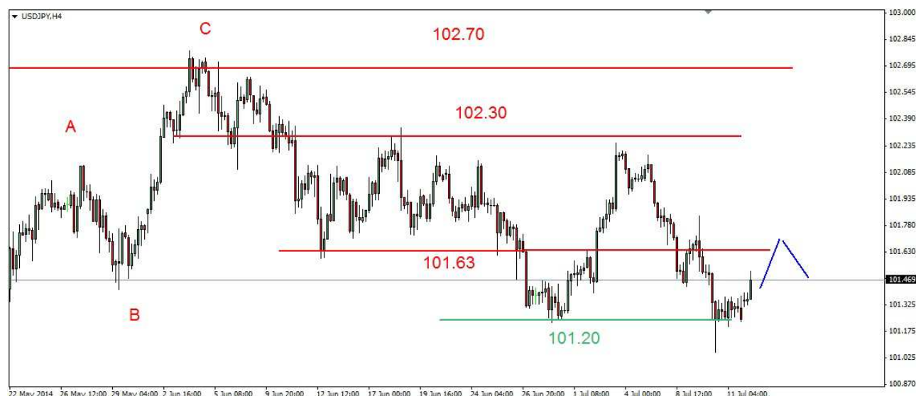
Wykres 3. Dolar amerykański w relacji do jena (USD/JPY)

USD/PLN Do czwartku kurs dolara spadał. Minimum wypadło na poziomie 3.0188 PLN, w ciągu dnia doszło do silnego wzrostu do 3.0464 PLN. W piątek dolar konsolidował się w przedziale 3.0366-3.0454 PLN, zamknięcie po 3.0396 PLN. Dziś rano doszło do spadku, obecnie dolar jest notowany po 3.0320 PLN (wykres 4). PROGNOZA: Sytuacja pozostaje bez zmian. W krótkim terminie możliwe jest cofnięcie. Po jego