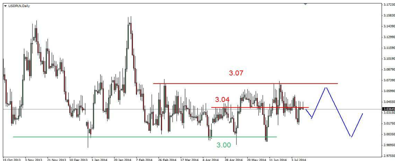
Wykres 4. Dolar amerykański w relacji do złotego (USD/PLN)

Kontrakty CFD na złoto Czwartkowe pogorszenie się sytuacji na giełdach akcji w USA przełożyło się na wzrosty na rynku złota. Kurs kontraktów na złoto przekroczył opór z połowy kwietnia (1331 USD). Kilkutygodniowy szczyt wypadł na poziomie 1345.60 USD. Potem doszło do wielogodzinnej realizacji zysków. W piątek niewiele się działo, trwała konsolidacja w rejonie 1334.90-1340.30 USD. Zamknięcie wypadło na poziomie 1339.60 USD. W poniedziałek w nocy kurs złota wybił się w dół. Przebite zostało krytyczne wsparcie w rejonie 1329 USD. Lokalne minimum wypadło na razie na poziomie 1318.60 USD. Obecnie złoto jest notowane po 1322.20 USD (wykres 5). PROGNOZA: Krótkoterminowe krytyczne wsparcie w rejonie 1329 USD zostało przełamane. W efekcie czwartkowy rajd na nowy szczyt okazał się pułapką. W perspektywie najbliższych sesji możliwe są spadki. Wsparcie znajduje się w rejonie 1307 USD, po jego przebicju otwiera się droga do wsparcia na poziomie 1290 USD.