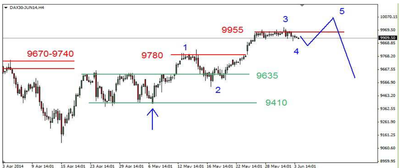
Wykres 3. Kontrakty CFD na indeks DAX

NIEMCY (Kontrakty DAX) W poniedziałek rano nieudała się próba wyłamania z 3 sesyjnej konsolidacji i doszło do spadku do 9910pkt. Zamknięcie wypadło na poziomie 9962pkt. We wtorek kurs kontraktów spadł do 9888pkt., zamknięcie po 9922pkt. Dziś rano doszło do niewielkiego spadku do 9899pkt. Obecnie kontrakty są notowane po 9906pkt. (wykres 3).