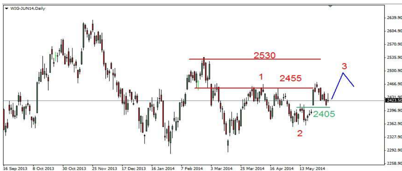
Wykres 1. Kontrakty na indeks WIG20

PROGNOZA: W krótkim kilkusecyjnym terminie gdy na giełdach w USA będziemy mieć falę piątą z nowymi szczytami, na naszym rynku może dojść do ataku na opór w rejonie 2383-2388pkt. (wykres 1, na rynku terminowym analogiczny opór jest położony kilkanaście punktów niżej). Być może opór ten zostanie przekroczony na krótki okres czasu. W dalszej perspektywie możliwy kilkutygodniowy korekcyjny ruch w dół. Po jego zakończeniu liczę na jeszcze jedną kilkutygodniową falę wzrostów.