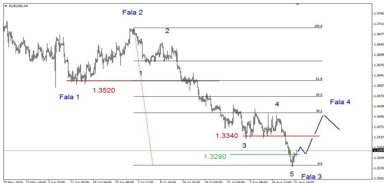
Wykres 1. Eurodolar w perspektywie średnioterminowej

GBP/USD W czwartek w nocy kurs funta spadł do 1.6563 USD, potem doszło do odbicia, dziennie maksimum wypadło na poziomie 1.6600 USD, zamknięcie po 1.6579 USD. Obecnie funt jest notowany po 1.6588 USD (wykres 2). PROGNOZA: Wydaje mi się, że jesteśmy blisko dna kilkutygodniowej fali spadków. Przed nami trwalsze 2-3 tygodniowe odbicie. Po jego zakończeniu możliwa kolejna kilkutygodniowa fala spadków.