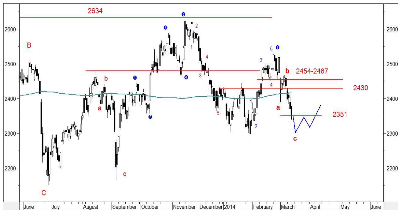
Wykres 1. Indeks WIG20

Na trwalsze wzrosty będziemy musieli poczekać na uspokojenie sytuacji geopolitycznej (w niedzielę nielegalne referendum na Krymie i potem zobaczymy jaka będzie decyzja Rosji). Po zakończeniu kilkutygodniowej korekty oczekuję na kolejną kilkutygodniową falę wzrostów (wykres 1). Kluczowy opór znajduje się w rejonie 2430-2440pkt.