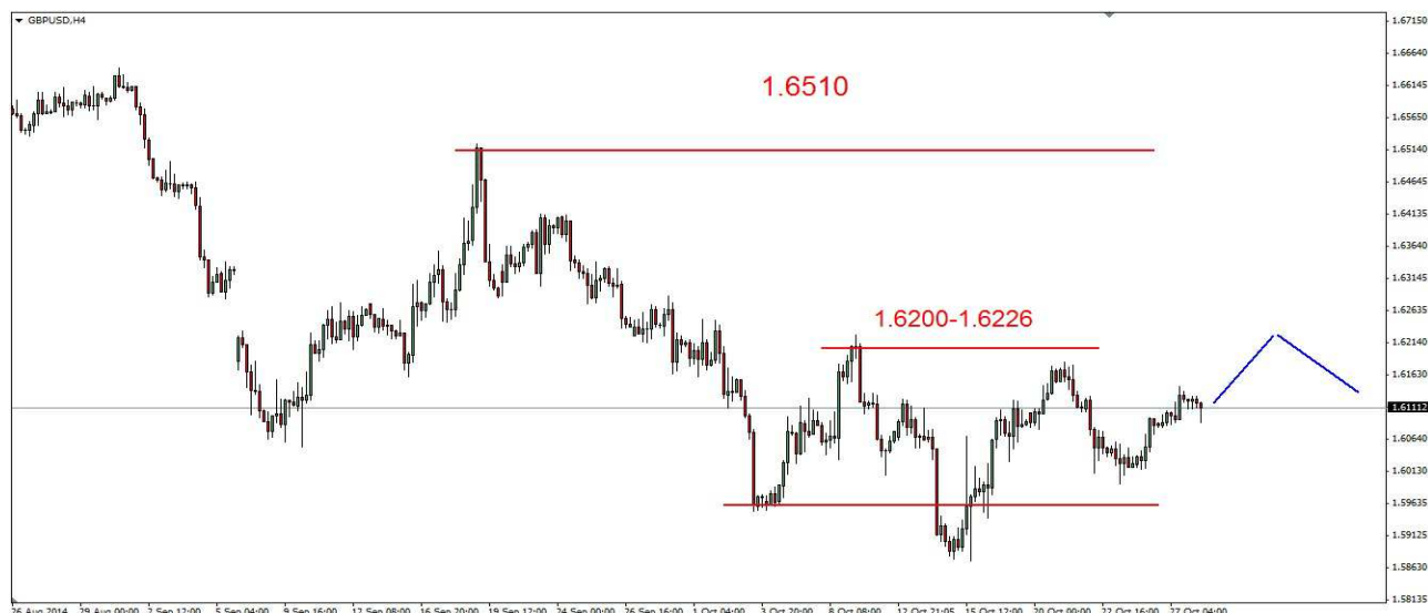
Wykres 2. Funt w relacji do dolara (GBP/USD)

USD/JPY W poniedziałek doszło do spadku do 107.61 JPY, pod koniec dnia nastąpiło odbicie, zamknięcie po 107.83 JPY. Dziś kurs dolara wzrósł do 108.13 JPY, obecnie dolar jest notowany blisko szczytu (wykres 3).