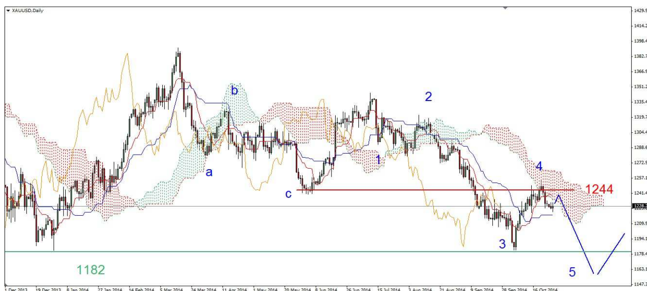
Wykres 5. Kontrakty CFD na złoto

Kontrakty CFD na złoto W poniedziałek doszło do spadku do 1225.29 USD, zamknięcie blisko dna po 1226 USD. Dziś doszło do wzrostu do 1232.15 USD, obecnie złoto jest notowane po 1228.85 USD (wykres 5). PROGNOZA: W krótkim terminie możliwe jest korekcyjne odbicie. Próba przełamania krytycznego oporu w rejonie 1244 USD oraz szczytu z poprzedniego tygodnia (1255 USD) nie powinna się udać. W kilkutygodniowej możliwy powrót na tegoroczny dołek na poziomie 1182 USD i jeszcze niżej.