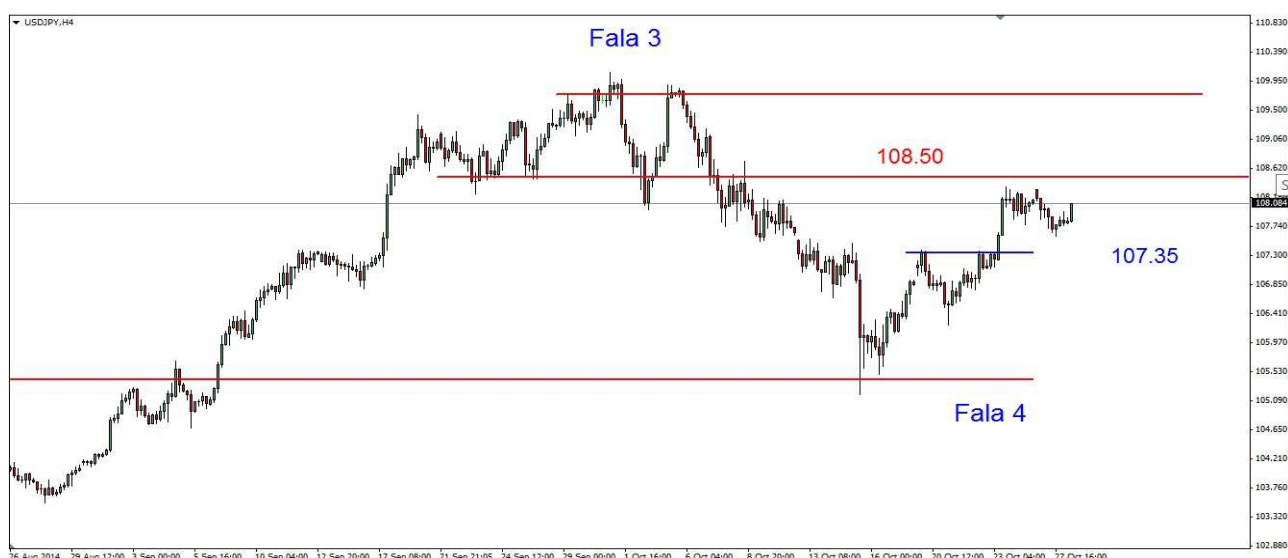
Wykres 3. Dolar amerykański w relacji do jena (USD/JPY)

USD/PLN W poniedziałek kurs dolar wzrósł do 3.3330 PLN, po południu doszło do niewielkich spadków, zamknięcie po 3.3340 PLN. Dziś doszło do wzrostu do 3.3306 PLN, obecnie dolar jest notowany po 3.3255 PLN (wykres 4).