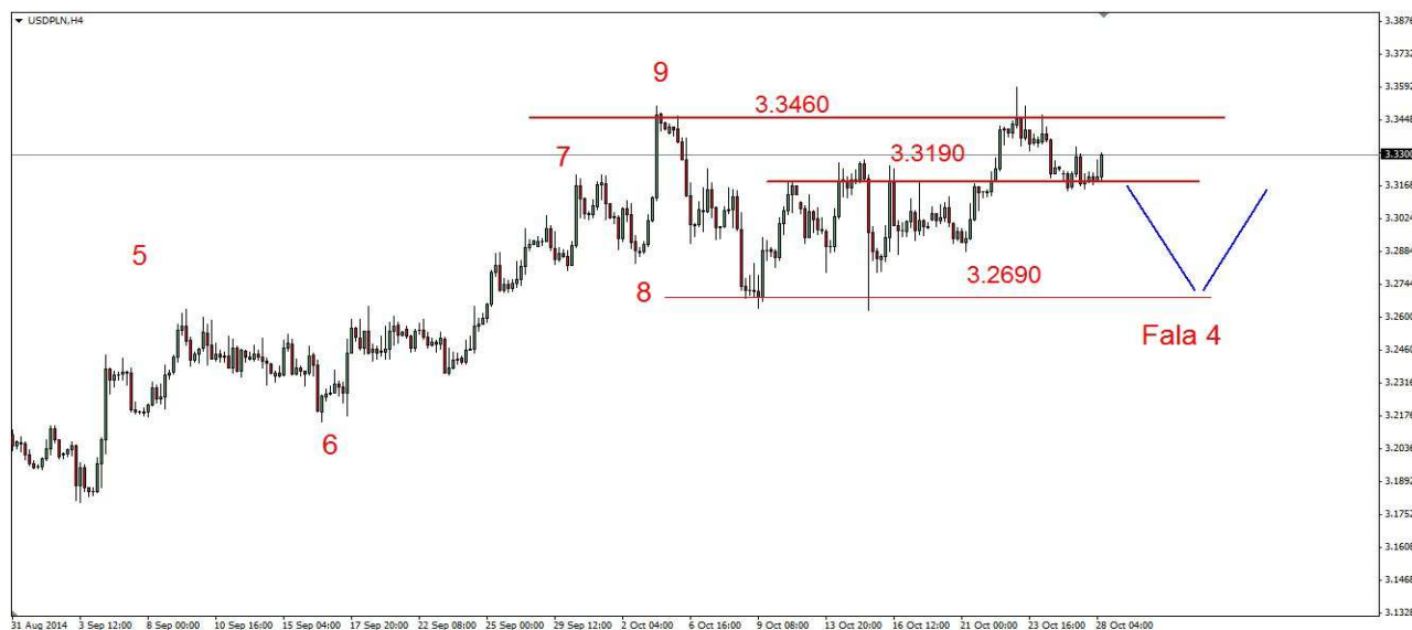
Wykres 4. Dolar amerykański w relacji do złotego (USD/PLN)

Kontrakty CFD na złoto W poniedziałek doszło do spadku do 1225.29 USD, zamknięcie blisko dna po 1226 USD. Dziś doszło do wzrostu do 1232.15 USD, obecnie złoto jest notowane po 1228.85 USD (wykres 5). PROGNOZA: W krótkim terminie możliwe jest korekcyjne odbicie. Próba przełamania krytycznego oporu w rejonie 1244 USD oraz szczytu z poprzedniego tygodnia (1255 USD) nie powinna się udać. W kilkutygodniowej możliwy powrót na tegoroczny dołek na poziomie 1182 USD i jeszcze niżej.