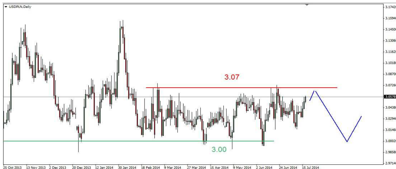
Wykres 4. Dolar amerykański w relacji do złotego (USD/PLN)

Kontrakty CFD na złoto W poniedziałek w nocy kurs złota przebił kluczowe wsparcie w rejonie 1329 USD. Dno wypadło na poziomie 1304.10 USD, potem doszło do odbicia. We wtorek mieliśmy kolejne dno na poziomie 1293.20 USD. Potem doszło do odbicia. W środę dotarło ono do 1304.20 USD. Dziś doszło do dalszych wzrostów do 1308.80 USD, obecnie złoto jest notowane po 1306.70 USD (wykres 5). PROGNOZA: Z czwartkowego szczytu (1345.70 USD) do dzisiejszego dna pojawiła się 5-falowa struktura. W krótkim terminie (2-3 sesje) możliwe jest korekcyjne odbicie. Opór znajduje się w okolicy 1310-1320 USD. Potem czeka nas jeszcze jeden ruch w dół. Z lipcowego szczytu powinna się pojawić tylko spadkowa korekcyjna trójka. W dalszej kilkutygodniowej perspektywie możliwy kolejny ruch w górę w rejon marcowego szczytu (1390 USD).