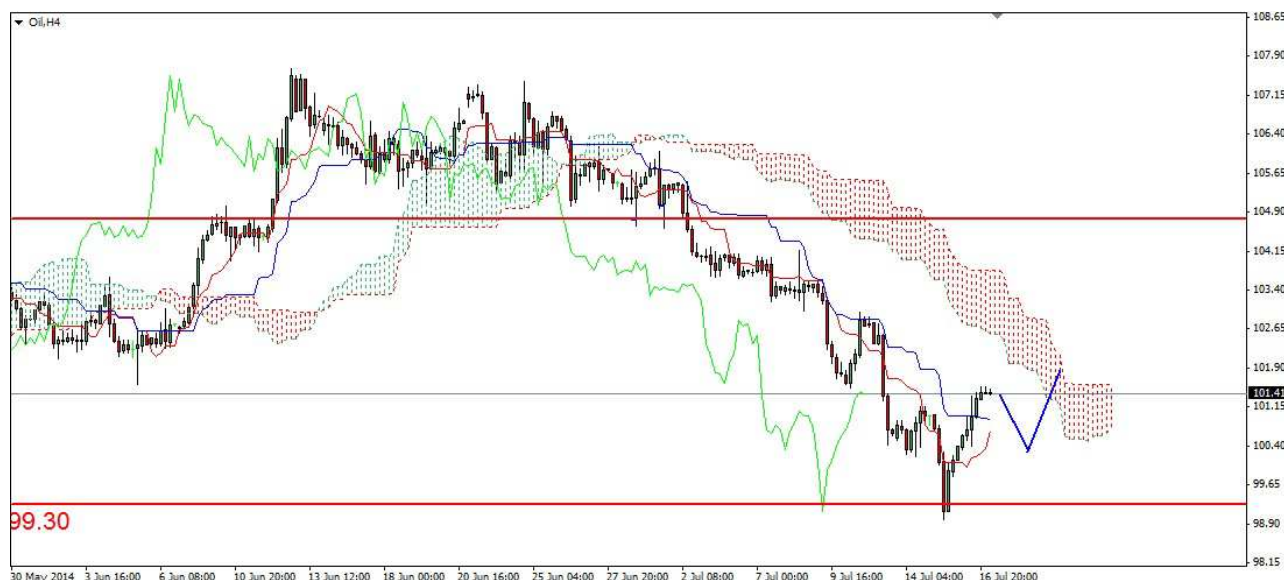
Wykres 6. Kontrakty CFD na ropę

PROGNOZA: Osiągnięte zostało bardzo ważne wsparcie w rejonie 99.30 USD. Próba przełamania na trwałe tak ważnego wsparcia nie powiodła się. W krótkim terminie możliwe jest korekcyjne cofnięcie, potem kolejny ruch w górę i atak na opór w postaci chmury Ichimoku.