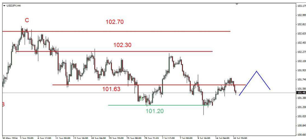
Wykres 3. Dolar amerykański w relacji do jena (USD/JPY)

USD/PLN W środę kurs dolara wzrósł do 3.0569 PLN, zamknięcie po 3.0537 PLN. Dziś rano doszło do wzrostu do 3.0588 PLN, obecnie dolar jest notowany blisko szczytu (wykres 4). PROGNOZA: W krótkim