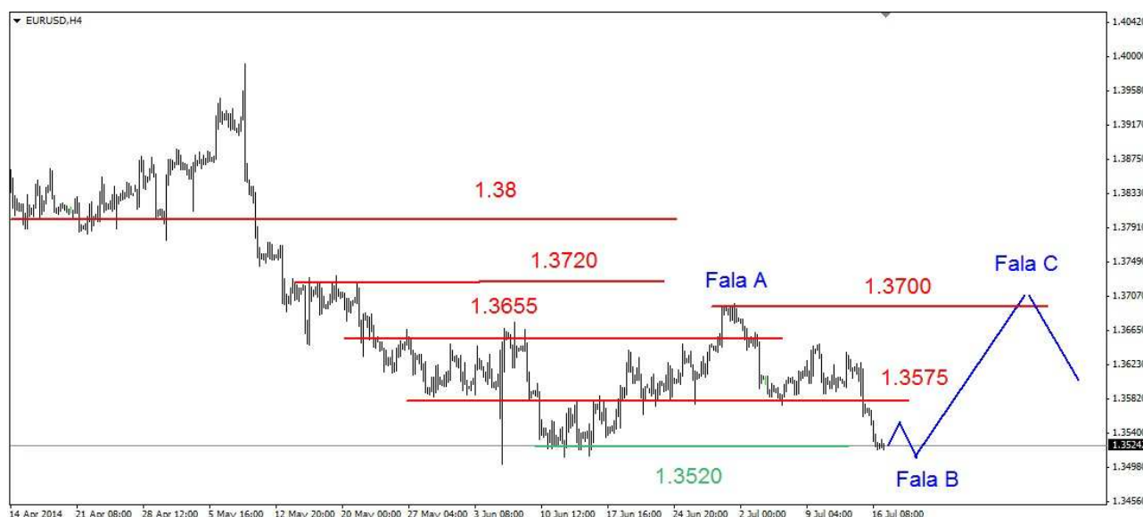
Wykres 1. Eurodolar w perspektywie krótkoterminowej

GBP/USD We wtorek doszło do wzrostu, lokalne maksimum wypadło na poziomie 1.7192 USD. Po godzinie 16-tej w reakcji na wystąpienie szefa FED (umocnienie dolara) doszło do spadków. W środę przed południem kurs funta spadł do poziomu 1.7109 USD, potem doszło do odbicia. Zamknięcie wypadło na