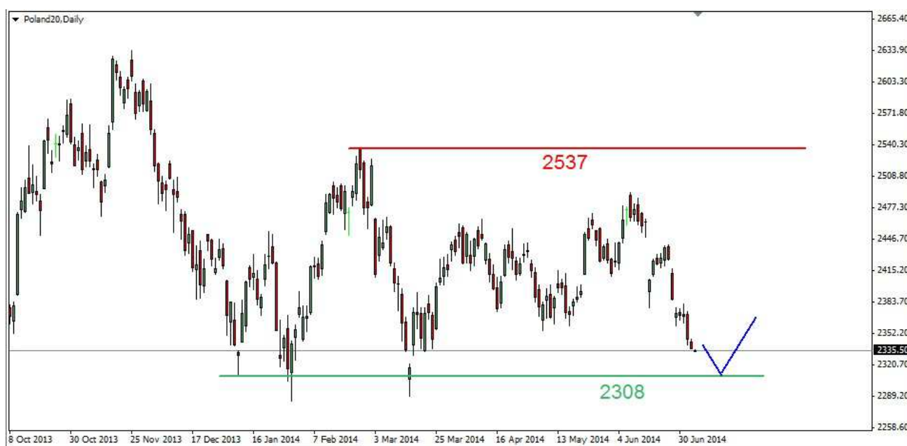
Wykres 1. Kontrakty na indeks WIG20

POLSKA (WIG20) Piątkowa sesja przyniosła dalszą słabość naszego rynku. Indeks cofnął się do poziomu 2364pkt. Po kilku minutach doszło do odbicia. Lokalny szczyt wypadł na poziomie 2375pkt. Po czym rynek zaczął się cofać. Po godzinie 11-tej doszło do odbicia, indeks wrócił pod poranny szczyt. Na fixingu indeks został zaniżony o blisko 10 punktów. Zamknięcie nastąpiło na dziennym dnie na poziomie 2363pkt. PROGNOZA W krótkim terminie na rynku kasowym być może czeka nas jeszcze test wsparcia w rejonie 2350pkt. Próba trwałego przetamania tego wsparcia jak i majowych dołków (2372-2376pkt.) nie powinna się udać. W dalszej perspektywie liczę na trwalsze wzrosty (wykres 1). Do jesieni możliwy atak na lutowy szczyt na poziomie 2527pkt.