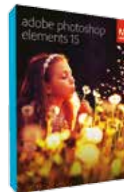
ADOBE PHOTOSHOP ELEMENTS 15 Cena: 360 złotych