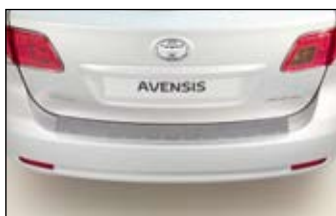
Nakładka ochronna na tylny zderzak