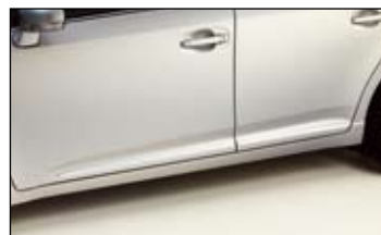
Chromowane listwy boczne