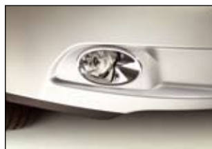
Chromowana obudowa lamp przeciwmgielnych