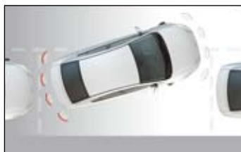
Czujniki parkowania tylne (Luna, Sol, Sol Plus) lub przednie (Prestige)