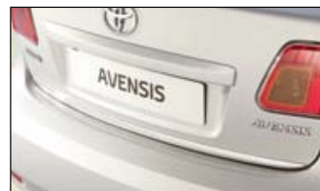
Chromowana listwa na klapę bagażnika