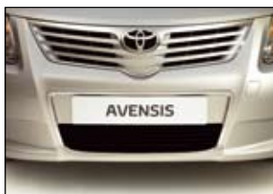
Chromowana listwa na zderzak