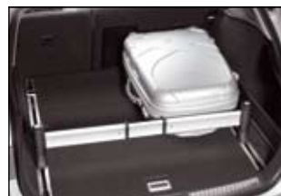
Cargo manager – uchwyt do stabilizacji bagażu (Wagon w wersjach Sol Plus i Prestige) lub siatka (Wagon w wersjach Luna i Sol oraz Sedan)