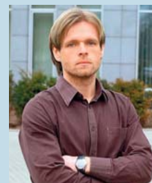
red. Marcin Matus

Oto drugie wydanie „Auto Świat Extra. Testy długodystansowe”, w którym prezentujemy kolejne 23 samochody. Każdy z nich poddaliśmy morderczej próbie na dystansie 100 tys. km, następnie rozłożyliśmy na części i dokładnie zbadaliśmy pod okiem fachowców. Wszystko po to, aby jak najdokładniej określić jakość, trwałość i koszty codziennej eksploatacji tych aut. Wyniki są bardzo ciekawe. Zachęcam do zapoznania się z nimi, tym bardziej że łamią pewne stereotypy.