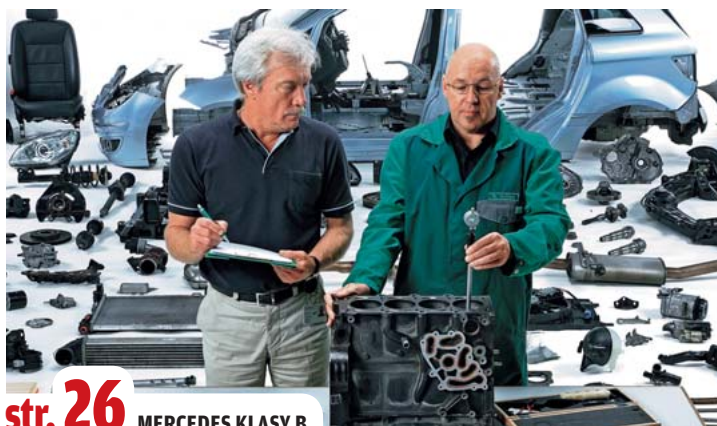
str. 26 MERCEDES KLASY B