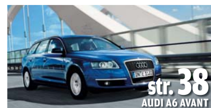
str. 38 AUDI A6 AVANT