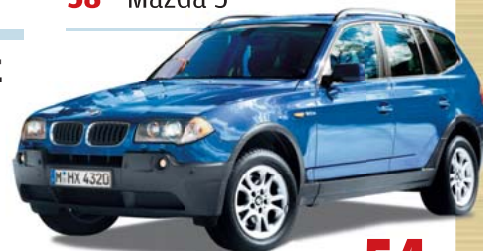
BMW X3 str. 54