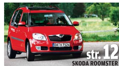
str. 12 SKODA ROOMSTER

OPEL ASTRA III 1.9 CDTI ORAZ VW GOLF V 1.4 NA DYSTANSIE 200 TYS. KM